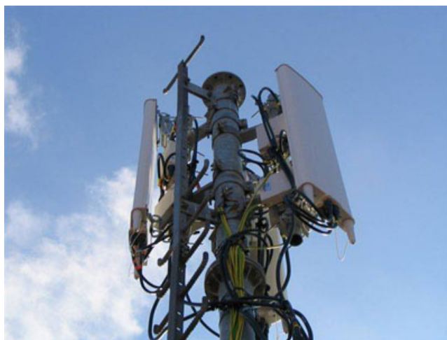
Figura 1. Primer plano de una estación base de telefonía móvil.

Desde la segunda mitad de los años 90 del pasado siglo se ha realizado el despliegue de la red de estaciones base de telefonía, que ha incrementado en varios órdenes de magnitud la contaminación electromagnética por microondas, especialmente en las ciudades, pero también en el campo, cerca de los núcleos rurales y las infraestructuras viarias. La intensidad de campo eléctrico en un punto concreto en las proximidades de una antena varía continuamente entre ciertos niveles, dependiendo del número de comunicaciones que soporta la estación base (número de móviles conectados en cada momento) ( Fig. 1 y Fig. 3 ). Existen continuamente cambios de la intensidad y la frecuencia en las señales GSM que les hace más bioactivas que los campos con parámetros constantes, posiblemente porque es muy difícil para los organismos vivos adaptarse a ellas, lo que puede hacer la vida en sus proximidades complicada (Panagopoulos et al. , 2004).