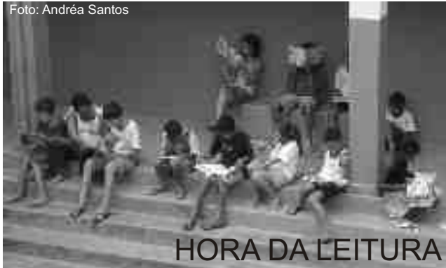
HORA DA LEITURA

A Secretaria de Estado da Educação (SEE-MG), no âmbito do projeto de Desenvolvimento profissional de Educadores (PDP), componente do projeto Estruturador "Desempenho e qualificação dos professores" recebeu propostas de constituição de Grupos de Desenvolvimento Profissional (GDP) das Escolas Referências e escolas convidadas pela SEE-MG, para participarem do processo competitivo para tornarem-se Escolas Referências para apoio científico-pedagógico e financeiro e projetos voltados para a melhoria dos processos de ensino-aprendizagem. Mais de 500 escolas participaram desta seleção.