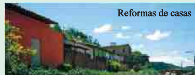
Reformas de casas

Secretaria Municipal de Assistência Social. Trabalhando e atuando na Família como um todo.