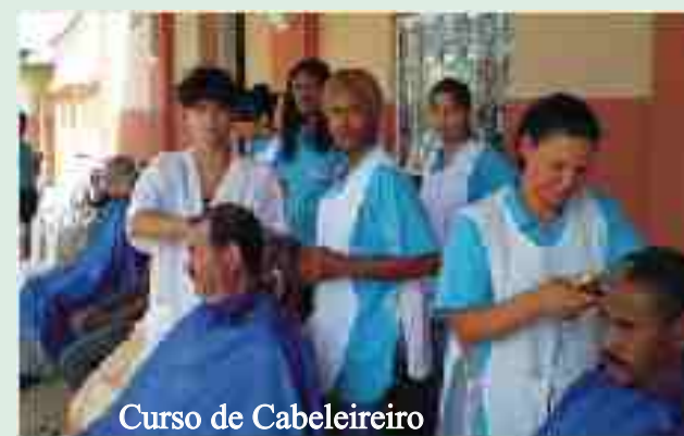
Curso de Cabeleireiro