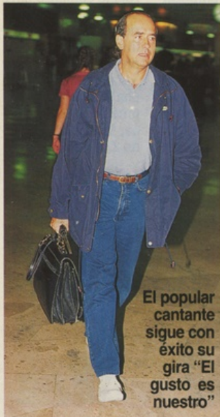
El popular cantante sigue con éxito su gira "El gusto es nuestro"