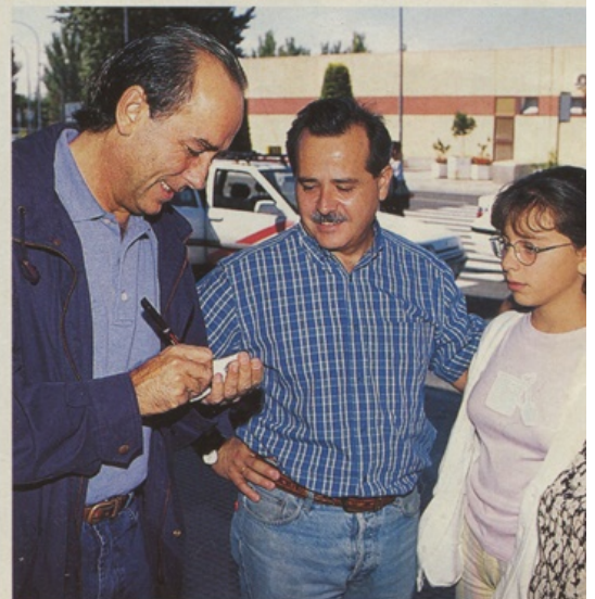
El popular cantautor barcelonés, que está recorriendo España con sus amigos Víctor Manuel, Ana Belén y Miguel Ríos, firmando un autógrafo para unos admiradores suyos

El hijo mayor del cantante, de 27 años, y su esposa esperan su primer hijo para diciembre.