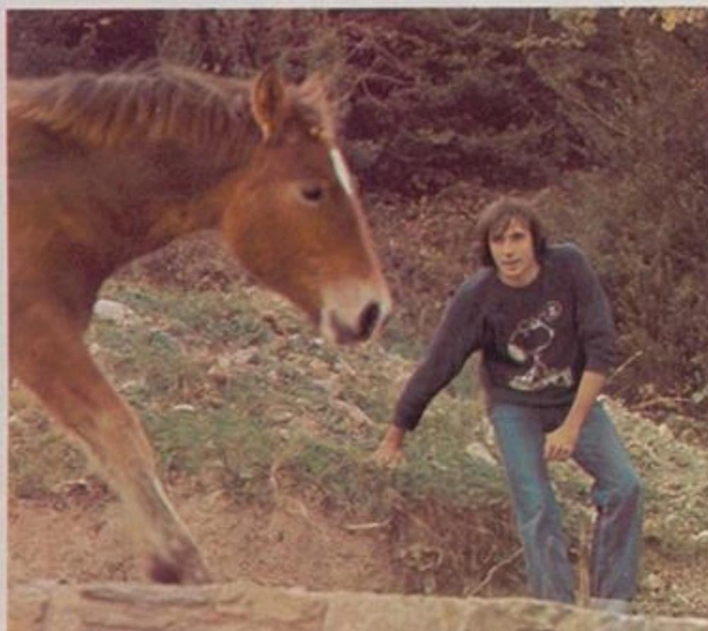
Joan Manuel Serrat con uno de los caballos que posee en su finca de Camprodón. El cantante adquirió esta masía con el terreno que la rodea, hace cinco años.