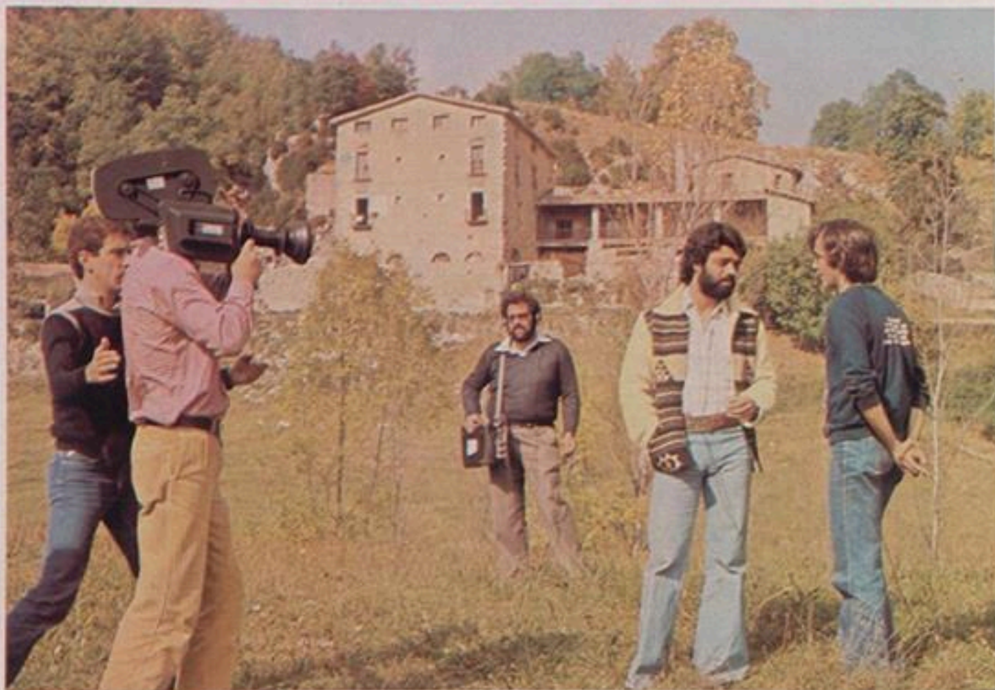
Miembros del equipo de grabación preparan una de las tomas de Serrat, ante la masía que el cantante posee en Camprodón, y donde él mismo sugirió que se rodara parte de su «especial» de televisión. La otra parte, la del recital, se hizo en el Teatro Lliure, de Barcelona.

El programa consta de un recital de nueve canciones y de unas