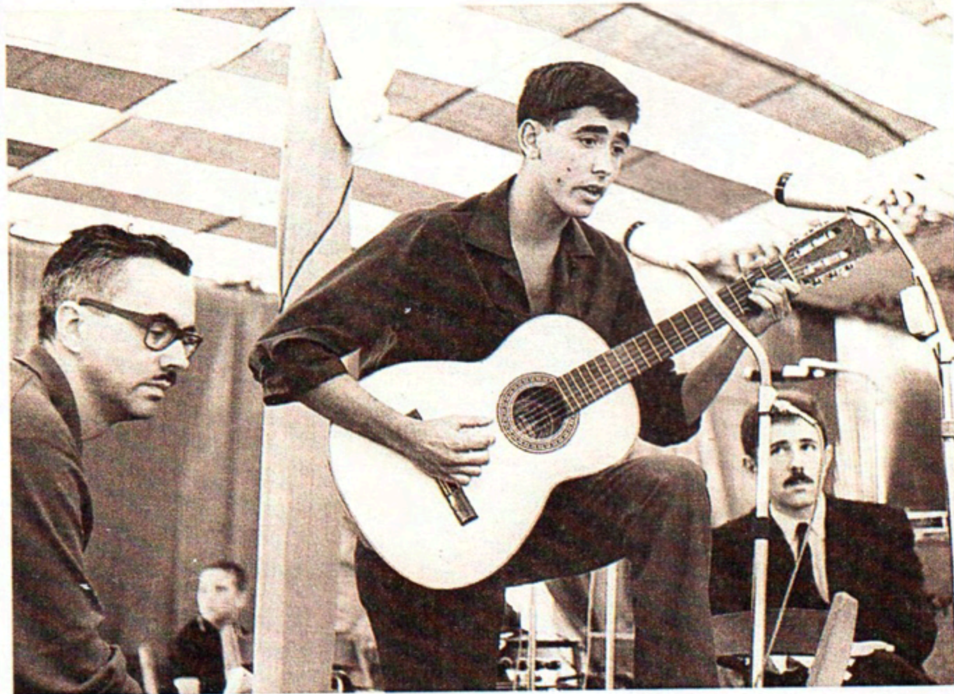
Un jovencísimo Serrat, entre Josep Maria Espinàs (izquierda) y Quico Pi de la Serra, en 1965.

→ he aprendido de este contacto: paisajes, comidas, humanidad, personajes, importantes o anónimos. Eso es un bagaje fantástico. Viajar educa mucho para la convivencia, para conocer lo iguales que somos todos los seres humanos.