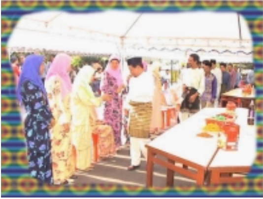
Tuan JD dan ketua-ketua bahagian sedang bersalam-salaman semasajamuan hari raya.