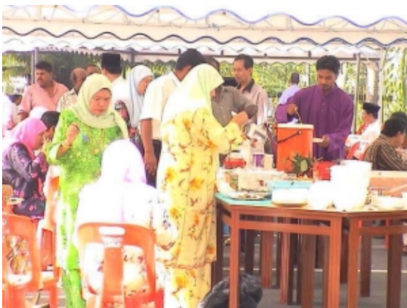
Jamuan Hari Raya di Perkarangan Pejabat