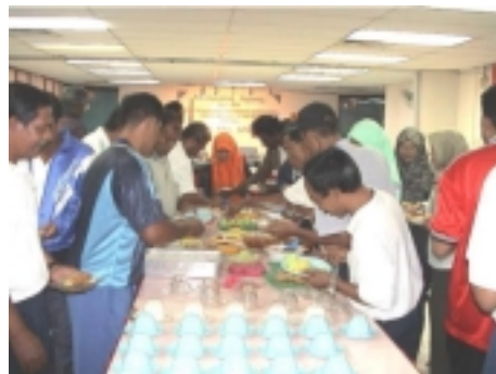
Jangan berebut... Banyak lagi makanan tu. Inilah suasana Majlis Jamuan Harijadi Yang diadakan setiap 3 bulan sekali