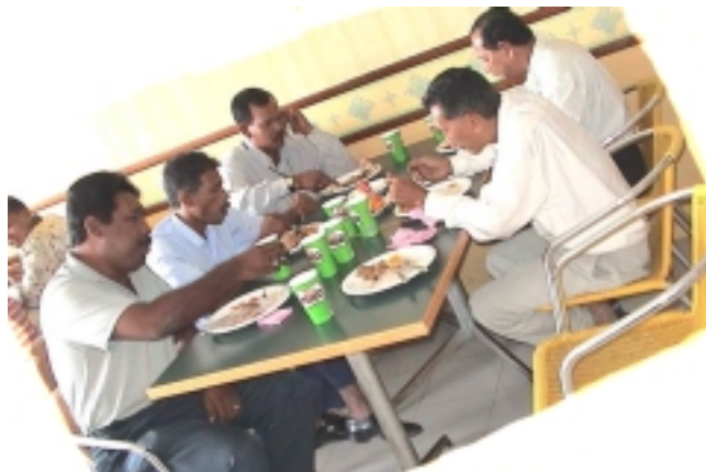
Amboi... Laparnya abang-abang kita ni, Tak ingat orang kat rumah ke.