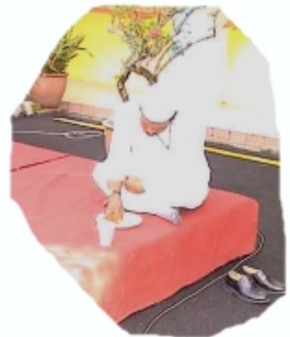
Hai... Kesiannya abang kita seorang ni. Merajuk ke...