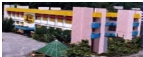
Pejabat Baru JKR

Jabatan Kerja Raya (J.K.R.) Taiping kini meliputi dua daerah, iaitu Larut dan Matang berserta daerah kecil Selama yang mempunyai keluasan 2,048 km/per. (800 b/ per). Dari catatan silam yang dapat di kesan, J.K.R Taiping telah diwujudkan pada tahun 1935 dan berfungsi di sebuah bangunan dua tingkat di Jalan Tameng Sari (dahulunya Jalan Besar), Taiping yang ketika itu dikenali sebagai 'TOWN HALL' yang terletak berhampiran Padang Esplanade dan ditempatkan di tingkat bawah. Di bangunan yang sama juga di tingkat atasnya pula merupakan Ibu Pejabat J.K.R Negeri Perak atau STATE ENGINEER OFFICE. Bangunan ini telah pun dirobohkan pada tahun 1975 di mana tapaknya kini telah dibina sebuah bangunan Dewan Perbandaran Taiping yang baru.