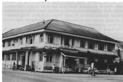
Pejabat Lama JKR

kakitangan telah dicadangkan memandangkan bangunan yang digunakan ketika itu (Jalan Stesen) adalah tidak lagi sesuai dan selesa bagi bilangan pekerja yang