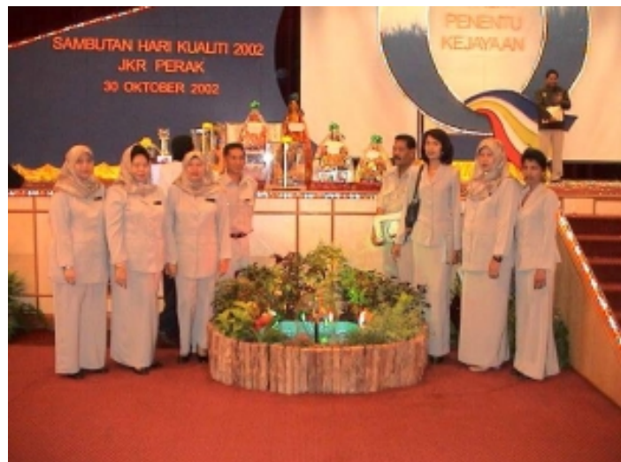
Ini adalah gambar kenangan Peserta KMK bersama-sama hadiah yang telah dimenangi semasa Hari Kualiti. Jabatan kita telah merangkul Piala Pusingan dalam semua kategori. TANIAH DIUCAPKAN.....