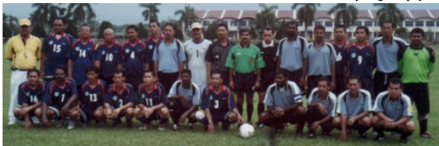
Pasukan Bola Sepak

Tahun 2002 juga adalah satu tahun yang cemerlang bagi ahli-ahli sukan kelab ini terutamanya bagi permainan badminton dimana JKR Taiping telah menjadi Johan acara tersebut bagi peringkat Daerah anjuran Kelab Sukan JKR Perak, di perlawanan akhir Pasukan Badminton JKR LM&S menewaskan pasukan dari Ibu Pejabat dengan 2-1 di mana pertandingan akhir itu diadakan di dewan Katholik Kuala Kangsar. Manakala pertandingan permainan bolasepak dimana JKR LM&S berjaya menjadi Naib Juara. Pasukan JKR LM&S tewas 0-1 kepada JKR Batang Padang pada perlawanan akhir di padang Sekolah Menengah Teknik Teluk Intan. Syabas diucapkan kepada yang berjaya.