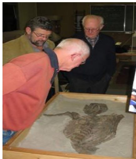
hoe zou Truus eruit hebben gezien ?

Met houtlijm zijn alle (gebroken) botjes geïmpregneerd en is het geraamte ook vastgekleefd aan de jute lap. Later is deze weggewerkt door er schoon zand op te lijmen. Er is een reconstructie van Truus gemaakt, maar die is alleen voor ingewijden, of mensen die onze werkruimte bezoeken...!