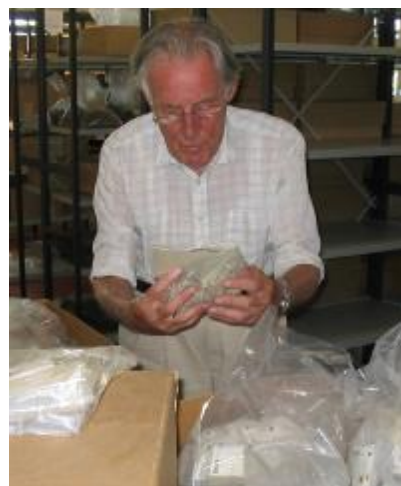
een mooie vondst

In het depot te Wormer zijn een twintigtal dozen met hoofdzakelijk bot fragmenten.