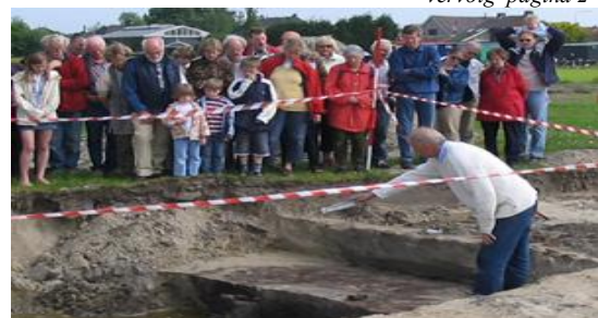
veel belangstelling op de open dag te Limmen