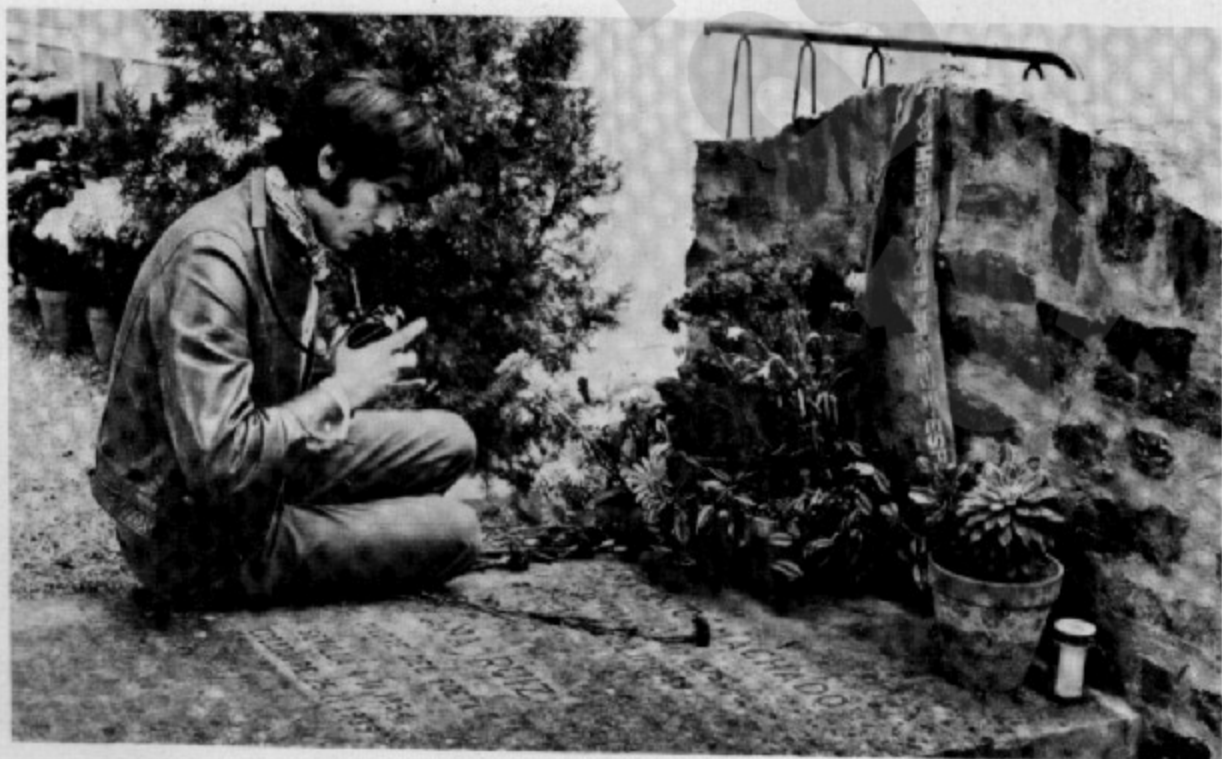
A la tomba d'Antonio Machado a Colliure, l'any 1968

coses de música. Com a la majoria del seu entorn i la seva generació, la ràdio és la principal font de cultura musical per als no iniciats. Sorgeixen els estils de moda i, per mimetisme, hi ha unes ganes d'imitar-ho. La colla d'en Joan Manuel decideix fer un conjunt, però degut a la manca de recursos se les empesquen totes per fer-lo funcionar: es construeixen artesanalment les guitarres elèctriques, es fabriquen els amplificadors i lloguen una bateria d'aquelles de can Montserrat. És l'època també que el «nano» ha