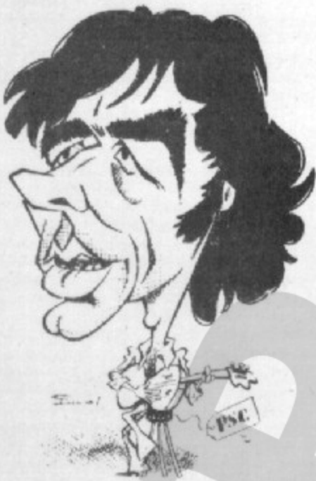
Caricatura de Puyal, publicada a l'«Avui»

L'any 1968 o l'exili que es veu forçat a suportar l'any 1975 i 1976 arfan d'unes declaracions antifranquistes. És el 16 de març del 1968 quan salta la notícia: Serrat a Eurovisió! Havia de cantar a Londres, defensant Espanya amb el «La, la, la» davant milions de telespectadors. Això comporta comentaris per a tots els gustos. Però el 25 de març esclata la segona bomba: Serrat es nega a cantar a Eurovisió si no és en català. Amb Franco viu i ben viu, i amb Fraga Iribarne com a