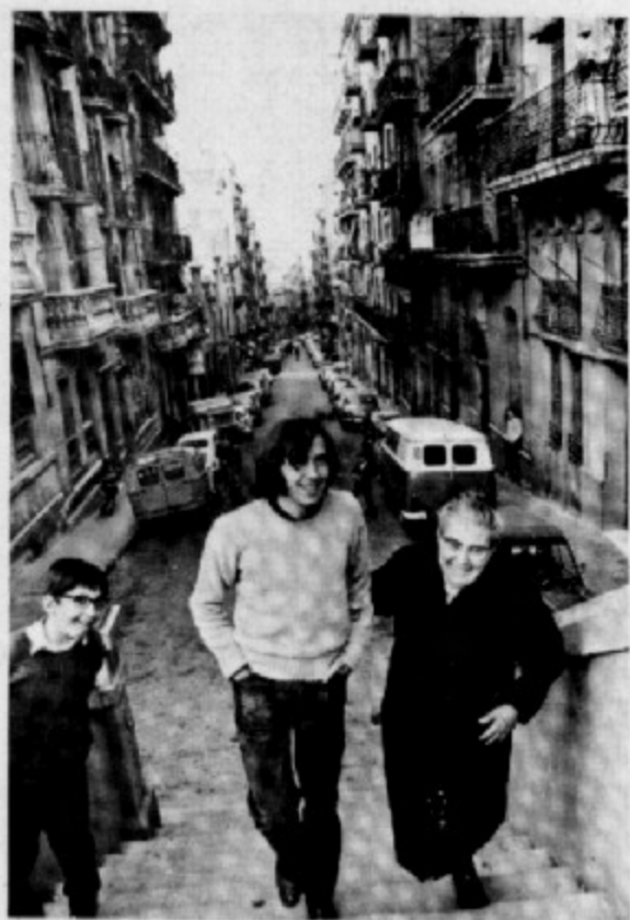
Al Poble Sec va transcórrer tota la seva infància i bona part de la seva joventut

cavall fort, passant per les baldufes, els patacons i l'àlbum Nestlé. També les seves primeres experiències amoroses, en algun dels carrers propers, en la zona del Paral·lel, quedarien reflectides més tard en la seva obra: «Benevolent / li agraden verges a l'adolescent / però com vostè / es menja el que troba pel carrer.»