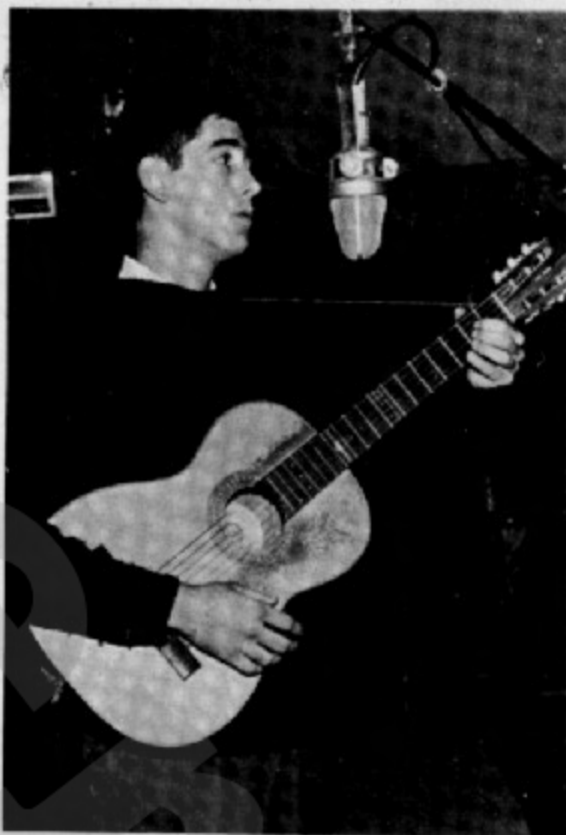
A l'estudi Toreski de Ràdio Barcelona, en una de les primeres actuacions