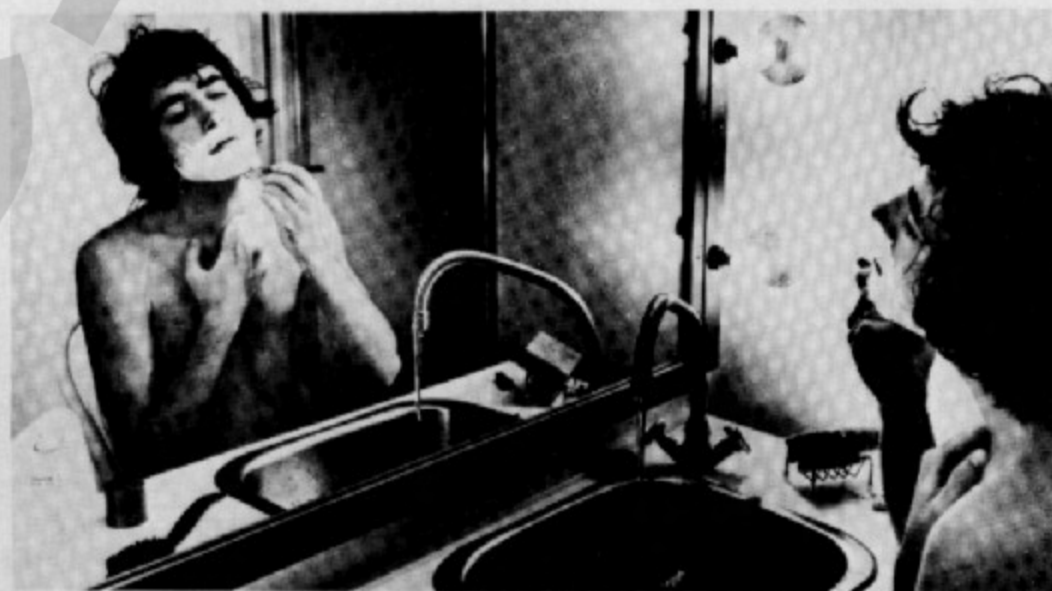
Al camerí, poc abans de començar el recital