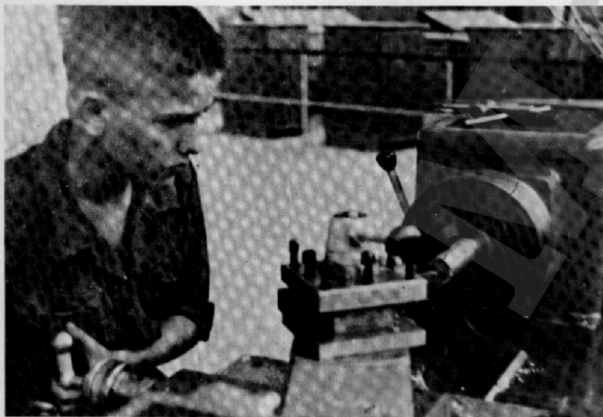
Fent anar el torn a la Universitat Laboral de Tarragona

Ens ho ha de dir la veu tremolosa i trista d'un campanar. Un cop de llum i el crit d'una garsa que ha despertat amb fam i busca qualsevol cosa per omplir el pap. O potser un gall que dins la cort canta: la nit és morta i ja es fa clar. Mentre jo canto, de matinada, la vila és adormida encara. S'han despertat mullades les fulles del camp d'alfals veí. S'espolsen l'aigua de la rosada mentre arriba la matinada i el sol que les escalfa, fins que les tallen d'un cop de falç. Alcen la testa mullada i fresca. Per caure a terra massa temps hi ha. Dintre la villa ja plora un nen i pels afores corren els bens. I amb sarró i la bóta a l'esquena, amb un bastó a la mà se'n va el pastor i el seu gos d'atura, se'n van cap a unes altres pastures. Trencant rius i cabanyes, a les muntanyes volen tornar. Surt amb l'aurora, cal sortir d'hora: el camí que han de fer és molt llarg. Cap a la vila ja ve el pagès, la bossa buida i el carro ple de roig tomàquet i de verdures collides del seu hort. La mula sua, el carro crida i l'home tanca els ulls i somnia, mentre el sol es lleva d'un llit d'alzines, enlluernant les velletes que pansidetes cap a l'església van caminant. I ara jo canto de matinada, la vila és adormida encara.