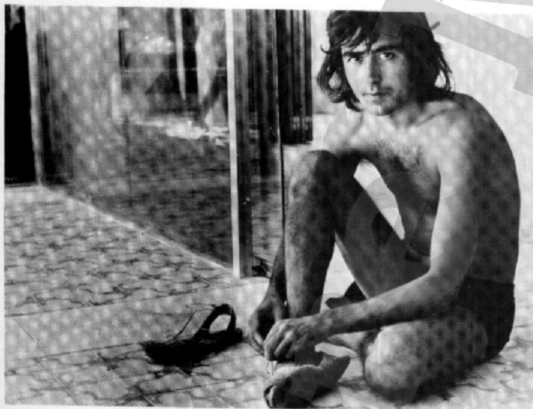
Pel setembre del 1971, a la Costa Brava

mença a escriure les primeres coses, en castellà, sense cap tipus de pretensió de gravar-ho o cantar-ho en públic, i amb una influència molt gran dels seus punts de referència que, en aquells moments, venien determinats per la música comercial, més tard per les cançons de Charles Aznavour i Gilbert Bécaud i, finalment, per Jacques Brel i Georges Brassens. En aquest ordre. «Però jo també vaig tenir altres influències que foren molt impor-