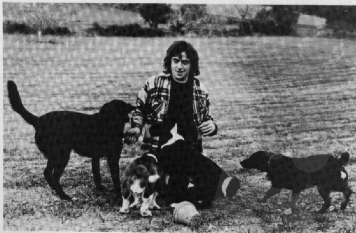
A Llofriu, pel novembre del 1973

tipus de comportament professional dels Setze Jutges. «Tot allò em va ajudar molt a consolidar el meu futur com a cantant d'una manera gens frívola i, sobretot, molt a prop de la gent.» Són temps que en Joan Manuel cobra vuit-centes o mil pessetes per recital; són temps que l'editora discogràfica té amb l'artista un tracte cordial, gairebé paternalista; són temps de compartir els bons i mals moments amb la resta de companys, sense els problemes de competitivitats que sortirien més tard. «La Nova Cançó fou un moviment que més que la importància que va tenir al seu dia, l'ha tingut en un desenvolupament general. La seva importància rau en l'origen popular, ja que si la cançó existeix és perquè la va fer possible la gent. I si jo existeixo com a cantant, és perquè aquest moviment ja hi era.»