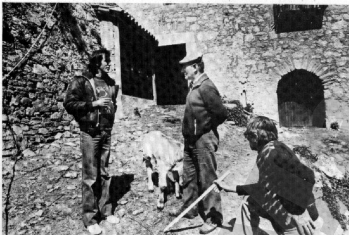
Amb els seus convilatans de Camprodon