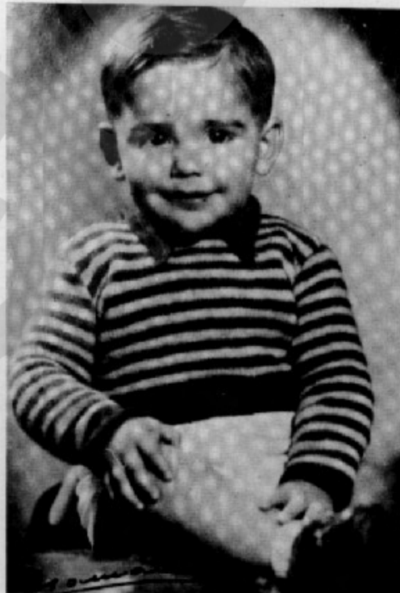
De petit ja era rialler