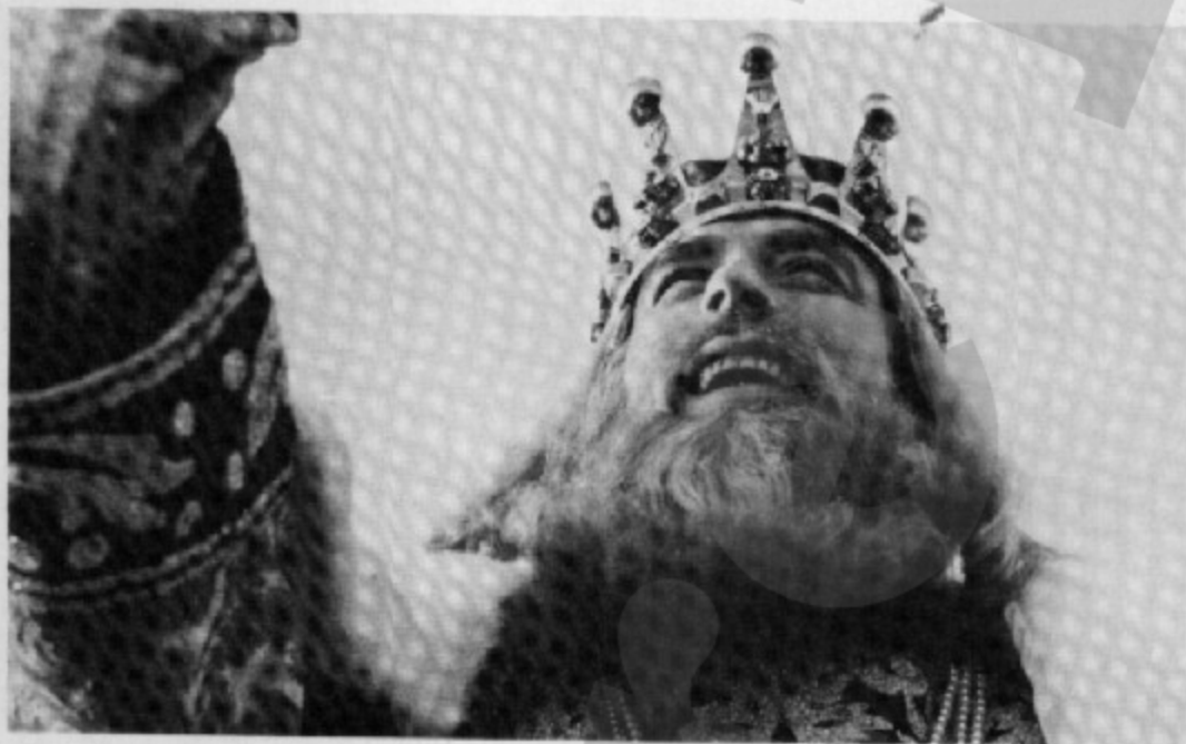
El 5 de gener del 1982 va fer de Rei Ros a la Cavalcada de Barcelona

moments que m'he sentit sol. Malgrat tot, però, la gent, la gent del carrer, m'ha fet sempre costat, i això és el que ha motivat que seguís endavant.»