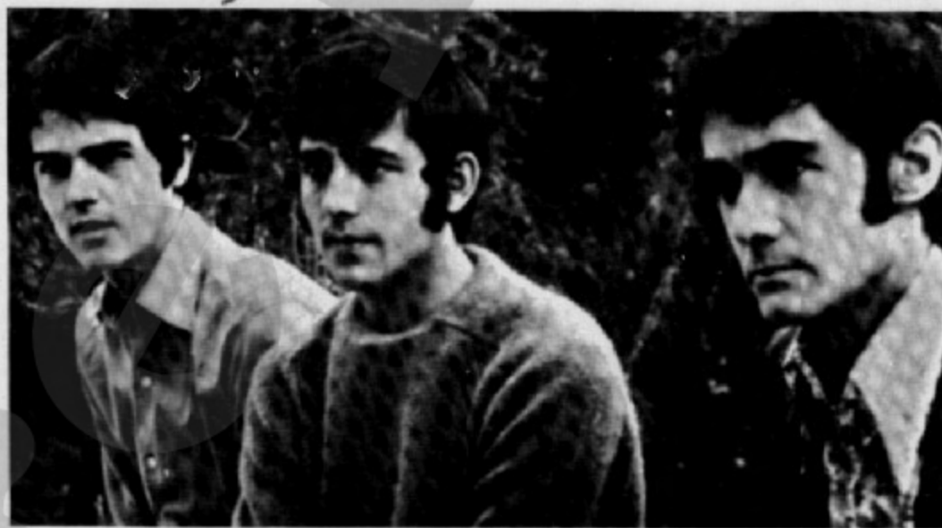
Amb Junior i Ramon Arcusa, del Duo Dinámico