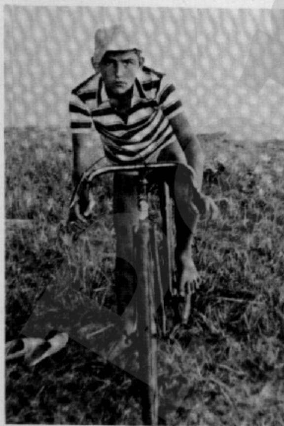
Sempre ha estat un bon aficionat al futbol i al ciclisme