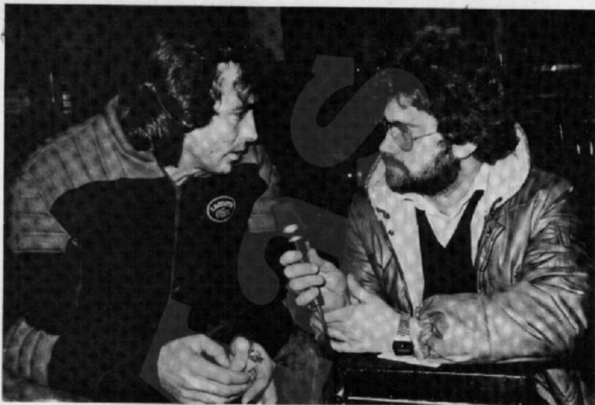
Joan Ramon Mainat l'entrevista per a Ràdio 4, a l'arribada d'una de les seves gires per Amèrica llatina