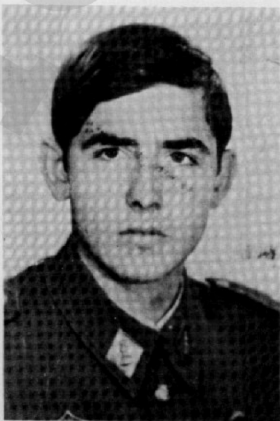
Va fer milícies i aconseguí el grau d'Alfereç