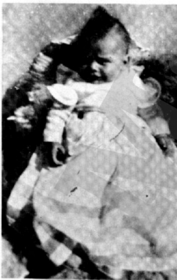
La primera foto