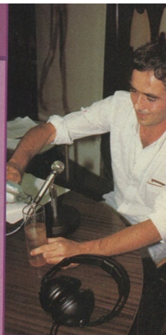
«De momento, no hay embarazo».