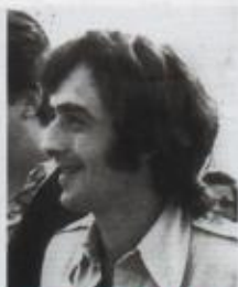
Joan Manuel Serrat (Barcelona, 1943). Cantante, compositor, poeta, músico, artista. Siempre a mitad de camino del castellano y el catalán; de una y otra orilla del Atlántico; con el Mediterráneo como eterno lugar de llegada. Y la lucha por la democracia como hoja de ruta. En su juventud se movió entre la biología y la agricultura, pero pesó más el amor por la música y la necesidad de ganar dinero acompañado por su guitarra. Comenzó su andadura en 1965 componiendo y cantando en catalán. De finales de esa década son sus primeras creaciones en español. Exiliado durante la agonía del franquismo, amante de México y Argentina, ha vencido al tiempo, el aburrimiento y la enfermedad y apuesta por 2015 como una fecha iniciática.

Usted ha alegrado la vida de mucha gente en tiempos difíciles. Y también ha tenido sus momentos duros: el exilio, la enfermedad... ¿Qué estímulos ha tenido en esas situaciones? En 1975, cuando me tuve que quedar fuera a raíz de los últimos fusilamientos de Franco, eso me afectó bastante en la parte creativa; era muy difícil escribir, todo lo que tengo escrito de aquella época es francamente malo, como si con todo lo que ocurría me hubiera quedado vacío. Tuve que inventar una gira por México de varios meses para alargar el proceso de la muerte de Franco, que parecía que no acababa nunca, hasta la transición que llevaba a la desaparición de los mecanismos represivos. Tuve dos cosas muy buenas, la primera haber conocido en aquella época a un grupo maravilloso de gente en el exilio en México, de Max Aub a Mantecón; y la suerte de conocer un país y de intimar con él. Llegó un momento en que ya no pude aguantar más y me vine. Recuerdo con la misma amargura también los años que no podía ir a Argentina o a Chile cuando estuve vetado por aquellos Gobiernos. La prohibición me parece un