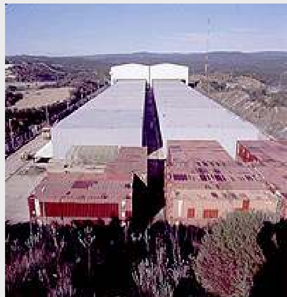
Celda donde se almacena la basura radiactiva de toda España.

Estas incoherencias no traen sino más desconfianza en una población que por lo bajo no hace sino repetir que hay excesivos casos de cáncer en la zona, y, lógicamente, la razón que se suele dar a menudo es la cercanía de El Cabril. Tanto si lo es, como si no es así, la población tiene derecho a saberlo, y para ello se hace imprescindible que se ponga en marcha también ese estudio en el Alto Guadiato, la Campiña de Badajoz y la Sierra Norte de Sevilla.