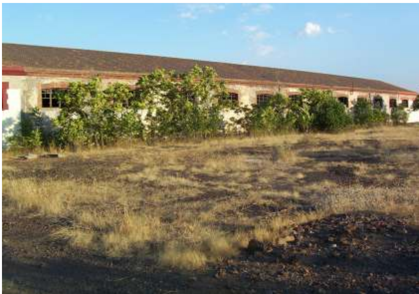
Terrenos donde se iba a ubicar el hospital.

¿Han visto ustedes algún documento sobre la contaminación del Cerco?. ¿Lo han visto de la mina Santa Rosa?.