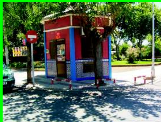
El Llano, Kiosco de la Andreita