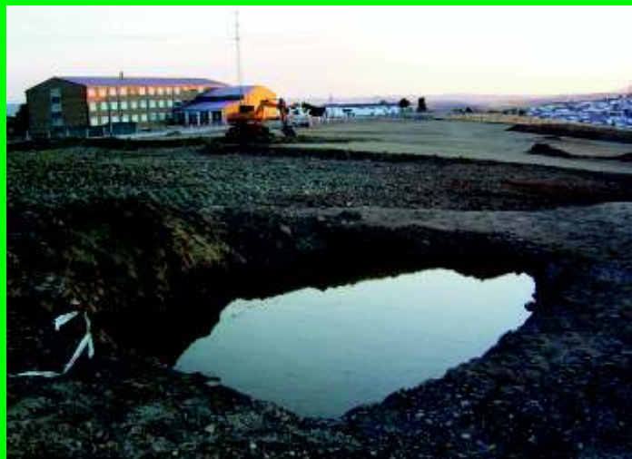
Tenemos donde puede que se ubique algún día el hospital.

Que se haya permutado un patrimonio municipal valorado en