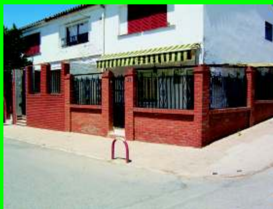
Calle Ronda del Guadiato entrada de La Guita