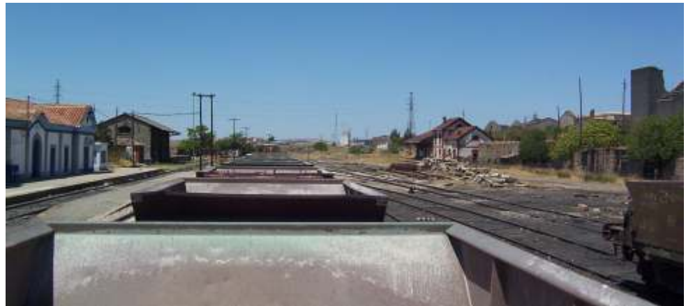
Estaciones de RENFE y FEVE abandonadas en Peñarroya