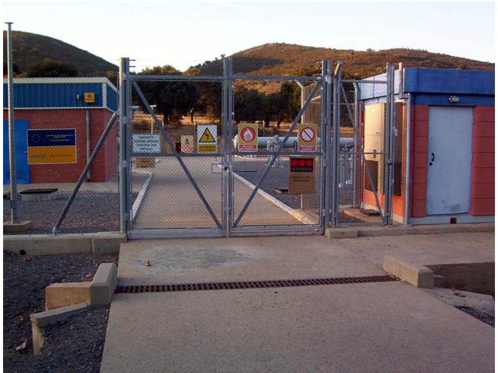
Instalaciones de distribución de gas en El Hoyo.

También se incide en la reciente firma del Miner II (2006-2012), en cuyas medidas de acompañamiento se estipula que desde la propia Junta de Andalucía se aporten medidas financieras de apoyo al mismo. En ese Plan ya se han presentado proyectos