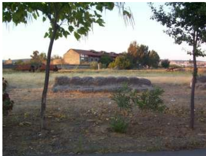
Vista de "El Cerco" desde la barriada de la Estación.

actual alcaldesa, de cambiar la ubicación del hospital del Cerco a Cerro Camelo aduciendo mentiras como la posible contaminación del suelo, abortó todos los proyectos que para con esta barriada había fijados por la anterior corporación como era la evidente unión con el centro de la ciudad, idea que hubiera puesto en valor todo lo que conforma "La Barriada" y el fácil acceso por un puente elevado, imaginense la dinamización de este lugar, nada más que como zona residencial. Por desgracia el mal está hecho, solo esperar que cumpla sus promesas con estos vecinos en el tiempo que se ha comprometido, que se lleven a cabo todas las propuestas en toda su dimensión, aunque el presupuesto nos parece muy corto para tanta obra, e insistir en que si se quiere se puede correr tanto como en la nueva calle peatonal, aunque se ganen menos votos.