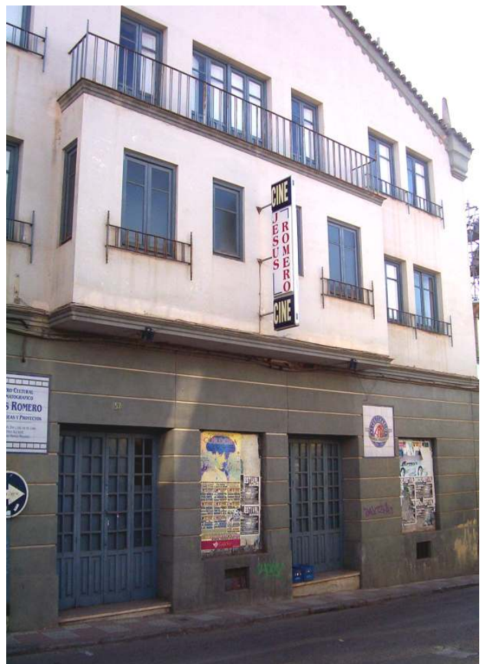
Centro Cultural Jesús Romero en peligro de extinción.

Guión versionado de la obra de Antonio Drove, "Tocata y Fuga de Lolita" en la que el protagonista, llamado Rafaé, pilla las de Villadiego en cuanto la cortisona (hormona del cabreo) le alcanza proporciones insoportables y en menos que canta un gallo coge puerta y desaparece del escenario. El espectador no puede ni parpadear o se perderá la vertiginosa fuga del personaje. Ya va por su cuarta edición... y subiendo.