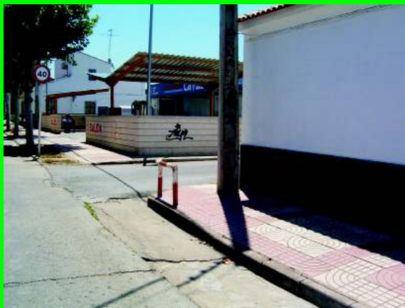
Avda. Simón de Lillo junto a lavadero de coches

entorno y en alguna de ellas se ha caído alguna persona mayor. Pero no pasa nada en la ciudad donde todo vale y todo da igual. Sirva este ejemplo de denuncia y ánimo a ciudadanos que ha sufrido y sufren sus consecuencia, sobre todo mayores.