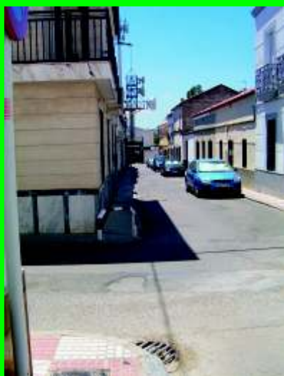
Calle Ramón y Cajal esquina Espartero