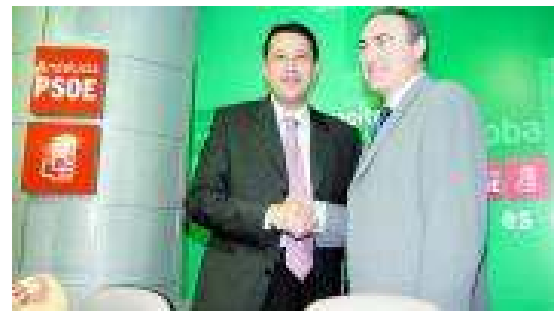
Ruiz Almenara en una de sus interpretaciones