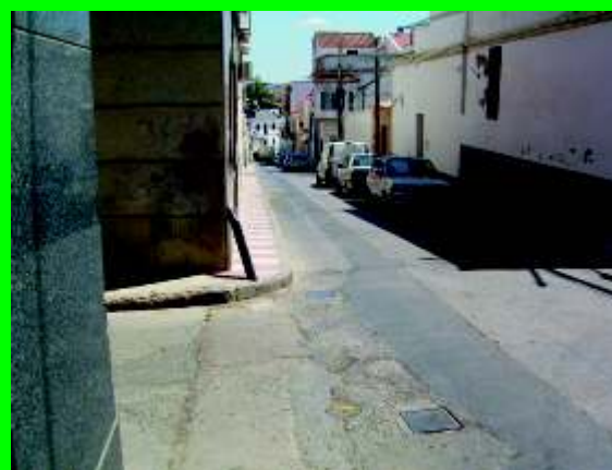
Calle Leones esquina José María Pemán