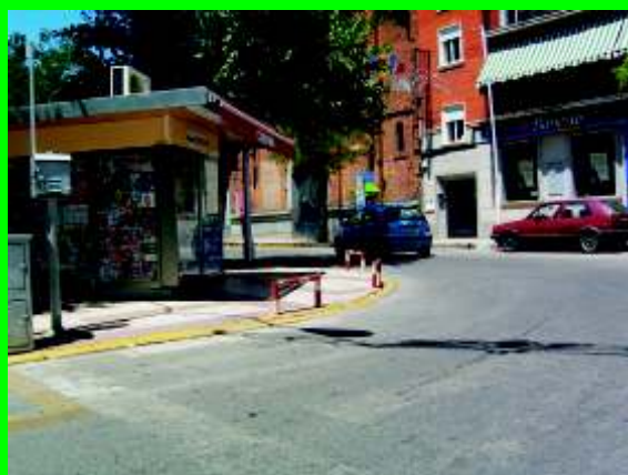
El Llano, Kiosco de la Vicenta