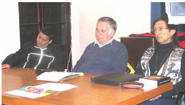
Acto en el Cabildo Histórico de Córdoba.

El día 5 de Junio pasado se presentó el libro en la ciudad de Córdoba, en el Cabildo Histórico, con la presencia de variado público entre los cuales muchos son descendientes de los pobladores originarios de la provincia que explicaron su proyecto de construir dos comunidades, una con sede en San Marcos Sierra y otra con sede en la ciudad de Córdoba, en Barrio Alberdi, antiguamente denominado Pueblo La Toma.