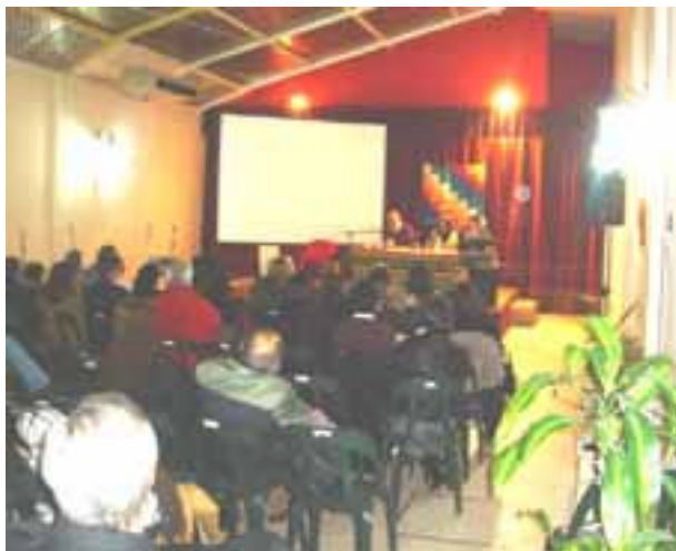
Acto en la Casa de La Rioja, Bs. As.

El día 26 de Junio se presentó el libro “Indígenas y Conquistadores de Córdoba” en la casa de La Rioja en Buenos Aires, ubicada en calle Callao 755 de esta ciudad.