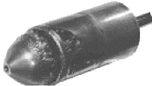
Fig.3 Apariencia Típica del Daño por Flasheo

Si la presión en la salida de la válvula permanece por debajo de la presión de vapor del fluido, las burbujas permanecen en el sistema de la salida de la válvula y se dice que el proceso ha flasheado. El flasheo puede producir serios daños por erosión a las partes internas de la válvula y se caracteriza por una suave apariencia pulida de la superficie erosionada, como se muestra en la figura 3.