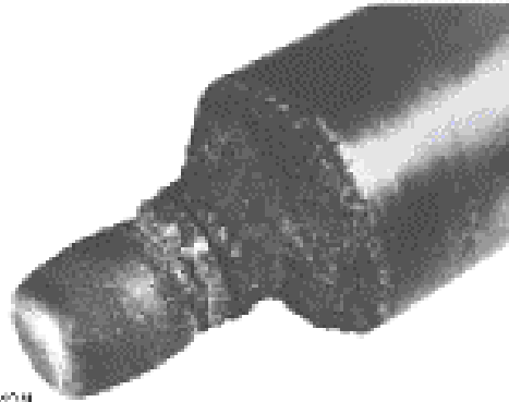
Fig.4 Apariencia Típica del Daño por Cavitación

El daño por Cavitación se puede extender a la tubería adyacente aguas abajo de la válvula, si es allí donde ocurre la recuperación de presión y el colapso de burbujas. Obviamente, las válvulas de alta recuperación tienden a estar más sujetas a Cavitación, debido a que es más probable que la presión aguas abajo se eleve por encima de la presión de vapor del líquido.