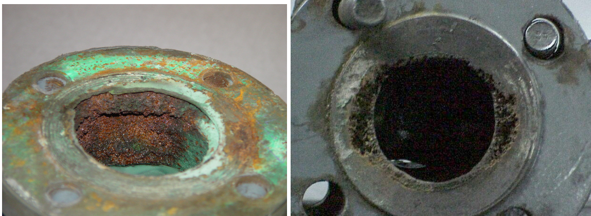
Fig.1 Erosión en válvulas de control De flujo de agua de celda columnar Claramente daño por Cavitación