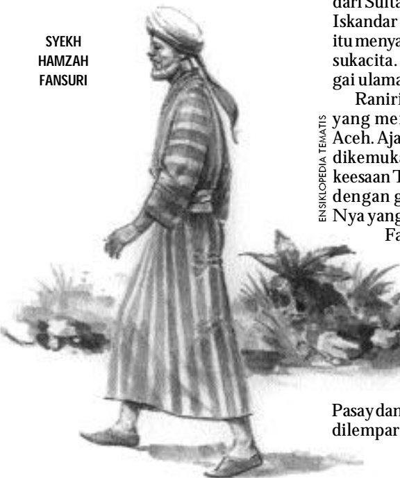
SYEKH HAMZAH FANSURI

Pasay dan Fansuri dijatuhi hukuman mati, dilempar ke tengah kobaran api.