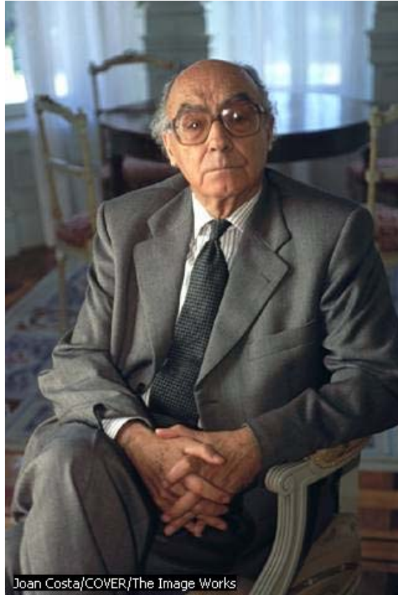
José Saramago (1922 - )