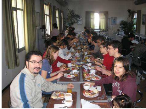
Una mesa entera para nosotros solos