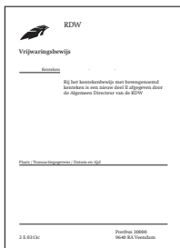
Model 3 E 0313

Verkoopt u uw voertuig aan een particulier, dan moet de overschrijving van het kenteken plaatsvinden op het postkantoor. De koper moet de overschrijving zelf regelen. Hij heeft hiervoor het tenaamstellingsbewijs en het overschrijvingsbewijs (oude naam: kopie deel III) nodig en zijn eigen legitimatiebewijs (zie paragraaf 2.3).