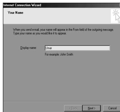
• Internet Connection wizard

count → Add → Mail ... Akan diikuti dengan tampilan Internet Connection Wizard. Ketikkan nama anda pada kotak Display Name. Tekan tombol Next. Ketikkan email anda pada kotak Email Address, misal saya@yahoo.com. Setelah menekan tombol Next, anda perlu mengatur setting Email Server Names. Pilih jenis server POP3 pada My incoming mail server, dan isikan pop.mail.yahoo.com dan smtp.mail.yahoo.com untuk setting pop dan smtp-nya. Selanjutnya pada kotak Internet Mail Logon, isikan dengan nama account dan password email Anda. Untuk saya@yahoo.com maka nama account - nya adalah "saya." Akhirnya tekan tombol Next dan Finish.