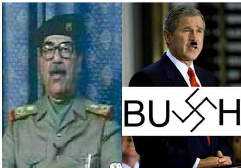
Figura 6 – Ilustrações de Identidade de Gênero Politizadas nos blogs

A guerra é a total iguino~rância dos homens. O Bush é louco e quer o petróleo do Iraque .Fora que morre um monte de gente que não tem nada a ver com a guerra (na maioria das vezes são crian~cas.)Pensando bem a gente vê que a guerra não vale a pena nunca'. Maria E mensagem:''Quero Paz ,Guerra nunca mais (BELLIZA et all, 2003).