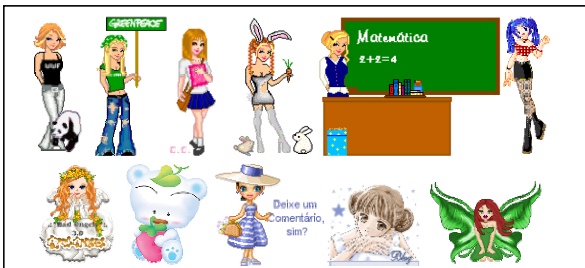
Figura 5 – Ilustrações de blogs com reprodução de discursos tradicionais

As mesmas meninas que reproduzem os valores eternizados na sociedade moderna, ou seja, julgar, rotular pessoas e situações sem prévia contextualização, são as que recheiam seus espaços virtuais com palavrões, xingamentos, ao mesmo tempo em que lançam mão de recursos tecnológicos bastante avançados para ilustrá-los de forma delicada, colorida, enfim, as representações gráficas aqui também remetem a uma identidade de gênero bastante tradicional como podemos observar na figura 5.