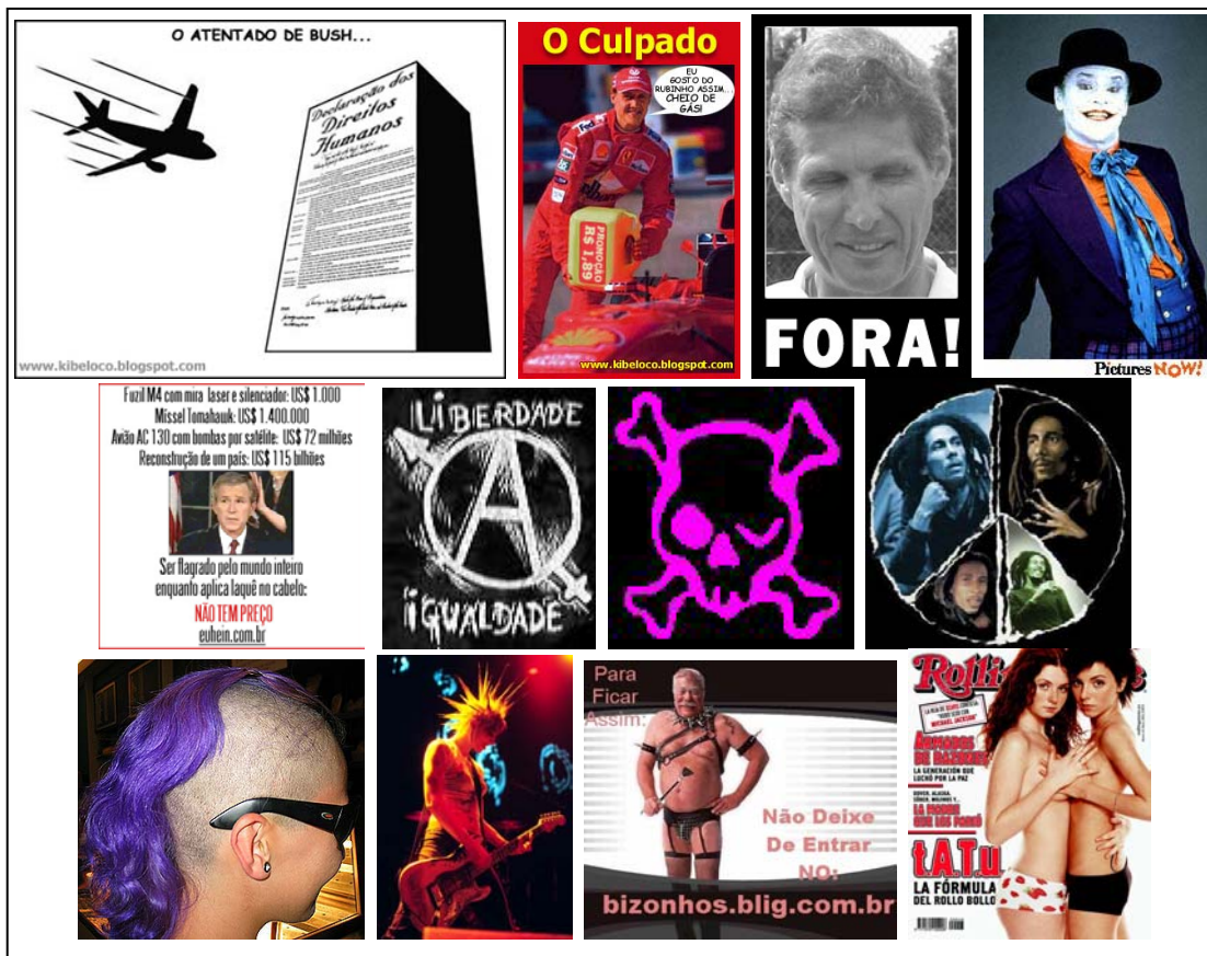
Figura 8 – Ilustrações de blogs com produção de discursos pós-modernos

Ando meio preguiçosa, quanto a cuidados estéticos. Pegando a primeira roupa que aparece, mal penteio meu cabelo. Higiene é básico, claro. Mas o resto está num momento de transgressão. Estou totalmente underground. Alternativa. É sempre assim. Quando eu tenho vontade de fazer as coisas de um lado. Do outro eu fico totalmente desorientada. Não sei, não consigo fazer as duas coisas da mesma forma. Chato, né? Mas que nada. O pior é que eu me sinto melhor assim. Não me sinto confusa. Estou agindo naturalmente. (MENDONÇA, 2003)