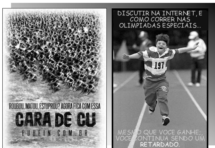
Figura 4 – Imagens utilizadas nos blogs para legitimar valores ocidentais

As mesmas meninas que reproduzem os valores eternizados na sociedade moderna, ou seja, julgar, rotular pessoas e situações sem prévia contextualização, são as que recheiam seus espaços virtuais com palavrões, xingamentos, ao mesmo tempo em que lançam mão de recursos tecnológicos bastante avançados para ilustrá-los de forma delicada, colorida, enfim, as representações gráficas aqui também remetem a uma identidade de gênero bastante tradicional como podemos observar na figura 5.