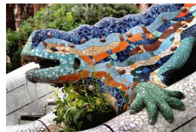
Abbildung: Dieser freundliche Drache begrüßt Sie am Eingang zum Parc Güell

Gehobene Küche kann man im Stadtteil Gràcia (S. 38) genießen. Überqueren Sie dazu die Travessera de Dalt, in den engen Gassen werden Sie bestimmt fündig.