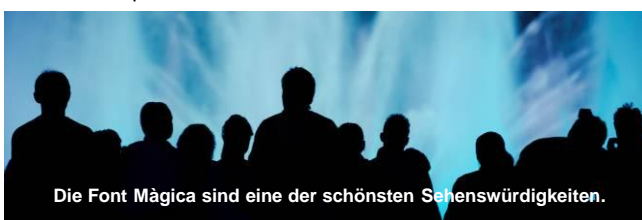
Die Font Màgica sind eine der schönsten Sehenswürdigkeiten.