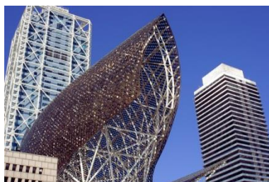
Bild: Der stählerne Fisch am Strand ist ein Wahrzeichen Barcelonas.

Ein ausgiebiger Spaziergang am Strand beendet diese Tour. Genießen Sie die Stimmung der untergehenden Sonne.