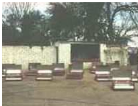
Vista de las cocinas terminadas ventilándose.

Desde el 30 de agosto hasta el 3 de setiembre se ventilaron las cocinas para eliminar el olor a pintura, dejando que levante temperatura el horno durante un lapso de tiempo con la puerta cerrada y abriendo durante otro lapso para ventilar los componentes de la pintura que pueden darle gusto a la comida futura.