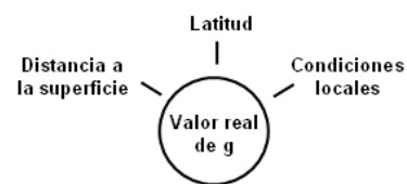
Figura 2. Factores que afectan el valor de g .

En realidad, siempre que sea razonablemente posible, la presentación de cualquier suceso o evento en física debiera cumplir tres pasos esenciales: experimento \rightarrow explicación \rightarrow confirmación. Es decir, se debe: (1) Presentar el fenómeno tal como ocurre en la naturaleza aunque sea mediante gráficos o en la pizarra (experimento u observación); (2) Proporcionar una explicación diga por qué esto es así (teoría) y; (3) Mostrar algún resultado derivado de la teoría que verifique la justeza de la explicación que se da al fenómeno (confirmación).