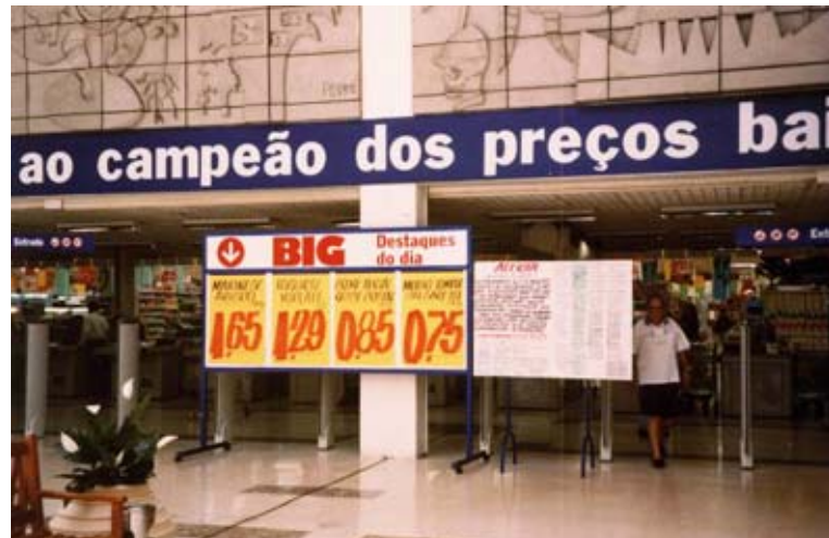
Figura 1 – Entrada de supermercado, com cartaz informando sobre alterações