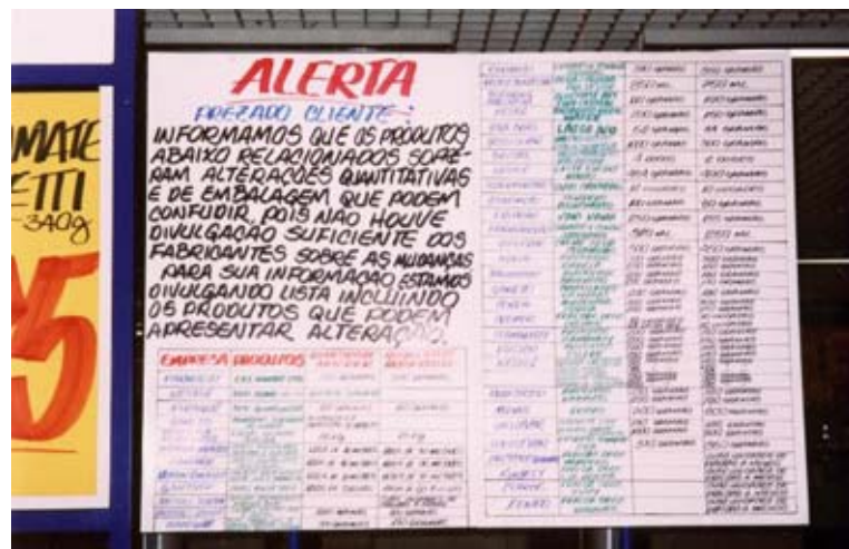
Figura 2 – Cartaz em supermercado informando alterações em produtos