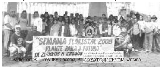
Participantes: Lions, IEF, Codema, Polícia Ambiental, Escola Santana

Em setembro, o Lions Sobral participou de atividades ecológicas e de meio-ambiente junto com o IEF, Polícia Ambiental, CODEMA e Escolas. Foi feita uma caminhada ecológica para chamar a atenção sobre a importância de se manterem limpas as ruas, avenidas e terrenos vazios. Foram plantadas mudas de árvores em algumas escolas (Santana e AMEC) com orientação aos alunos sobre a conservação das mesmas após o plantio.