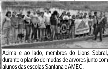
Acima e ao lado, membros do Lions Sobral, durante o plantio de mudas de árvores junto com alunos das escolas Santana e AMEC.