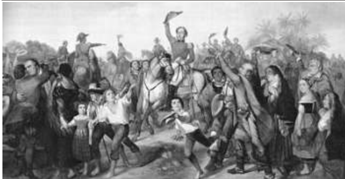
QUADRO DA INDEPENDÊNCIA DO BRASIL - MUSEU IMPERIAL DE PETRÓPOLIS