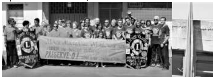
Acima, foto dos 2 clubes após o desfile

Já é tradicional, a participação do Lions Clube Sobral no desfile do dia 7 de setembro, juntamente com o Lions Centro. Neste ano tivemos a alegria de contar com um bom número de CCLL, CCaLL e DDMM que entenderam a importância dessa manifestação cívica.