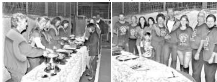
Acima, membros do Lions Sobral iniciam seu trabalho, servindo as massas

No dia 27 de setembro o Lions Clube de João Monlevade Sobral realizou a 16ª edição de um de seus mais tradicionais eventos, a Noite Italiana, com cardápio de massas diversas e vinhos. O evento conta ainda com música ao vivo e sorteio de brindes variados para os participantes.