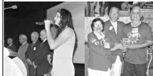
CaL Rose: Invocação a Deus CL Fernando: Melhor Boletim