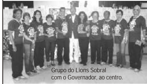
Grupo do Lions Sobral com o Governador, ao centro.