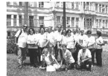
Ao lado o grupo dos Lions Clubes de Itabira, João Monlevade e Rio Piracicaba, que viajaram juntos para Viçosa e participaram da reunião do conselho distrital.