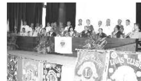
Os ex-governadores presentes se reuniram ao governador Morais na mesa principal e foram homenageados.

Ao finalizar conclamou os clubes e seus associados para a terceira convenção distrital a se realizar na cidade de São Lourenço, nos dias 13, 14 e 15 de abril.