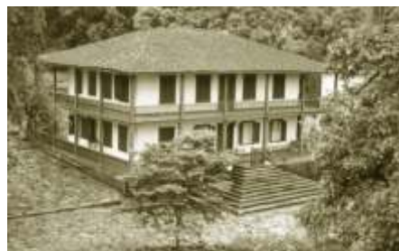
À esquerda, a Fazenda Solar, construída por Jean Monlevade, é, talvez, o principal marco da origem do município de João Monlevade. À direita, a Igreja São José Operário, construída pela Belgo em 1948, é o símbolo principal da cidade. A escolha foi feita no ano de 1999, através de votação popular