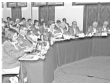
Governadores dos Distritos LC