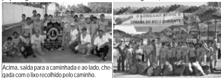
Acima, saída para a caminhada e ao lado, chegada com o lixo recolhido pelo caminho.

No dia 3 de junho, dentro da programação da semana do meio-ambiente, o Lions Sobral, participou com outras entidades e alunos da Escola Estadual Santana, de uma caminhada de cerca de 3km, entre o estádio Louis Ensch e o posto Longana. O objetivo da caminhada foi mostrar, principalmente, às crianças, a necessidade de recolhimento correto de lixo como plásticos, papeis, garrafas, metais, etc, enfim, o lixo de degradação mais demorada.