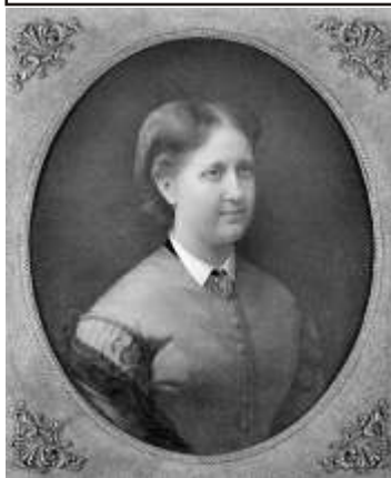
Quadro da Princesa Isabel, pintado em 1868 pelo pintor francês Edouard Vionot, exposto no Museu Imperial de Petrópolis.

Introdução: Na época em que os portugueses começaram a colonização do Brasil, não existia mão-de-obra para a realização dos trabalhos manuais. Diante disso, eles procuraram usar o trabalho dos índios nas lavouras; entretanto, esta escravidão não pode ser levada adiante, pois os religiosos se colocaram em defesa dos índios condenando a sua escravidão. Assim, os portugueses passaram a fazer o mesmo que os demais europeus daquela época, buscando negros na África para submetê-los ao trabalho escravo em sua colônia. Deu-se assim, o início da escravidão no Brasil.