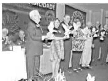
Governadores receberam o troféu água