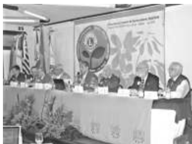
Conselho de Governadores