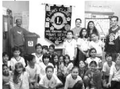
CL Clever com alunos da AMEC em uma das palestras

O Lions Sobral participou de algumas atividades da semana mundial do meio ambiente que teve palestras diversas. As palestras foram ministradas em Escolas da cidade e versaram sobre temas como fiscalização ambiental, reciclagem de materiais, plantio de árvores, coleta seletiva e tratamento de lixo, redução no uso de sacolas plásticas, etc.