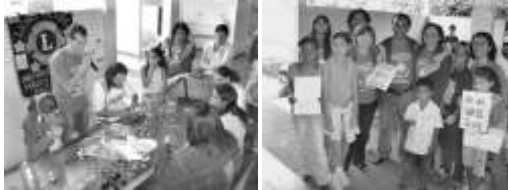
Oficinas de reciclagem de materiais e pintura