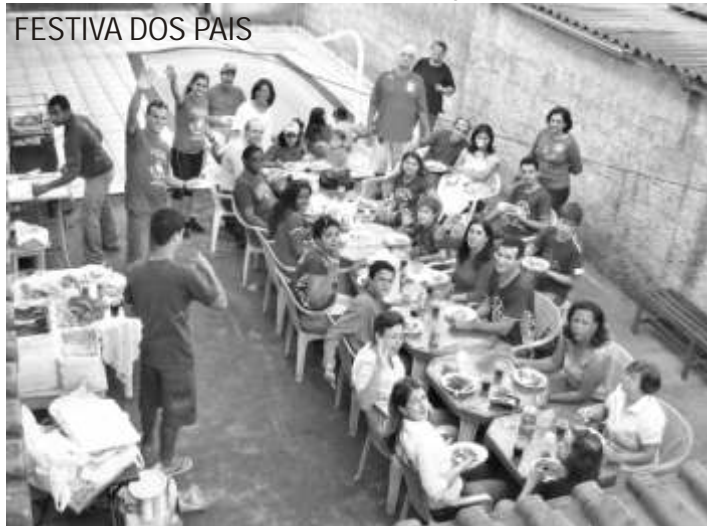
FESTIVA DOS PAIS