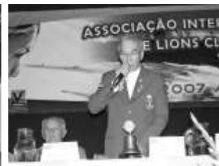
Governador Waldemar Montezano faz seu pronunciamento e apresenta o programa de atividades do distrito para o AL 2007/2008.