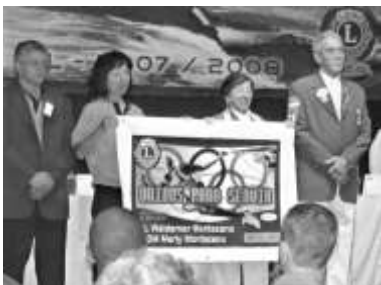
As domadoras Elena e Marly apresentam a bandeira da governadoria, AL 2007/2008, à esquerda, pelo ex-governador imediato CL José Moraes e pelo governador CL Waldemar Montezano.