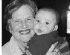
Dra. Zilda Arns Neumann Médica, Pediatra e Sanitarista. Fundadora e Coordenadora Nacional da Pastoral da Criança. Representante titular da CNBB no Conselho Nacional de Saúde

Organismo de Ação Social da CNBB - Conferência Nacional dos Bispos do Brasil, a Pastoral da criança é ecumênica, ou seja, aberta às pessoas de todas as