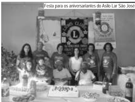
Festa para os aniversariantes do Asilo Lar São José