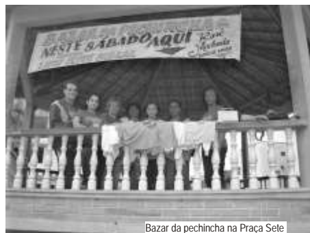
Bazar da pechincha na Praça Sete