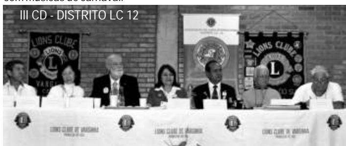
III CD - DISTRITO LC 12

Na noite de Sábado, dia 14, foi realizada uma excelente e alegre noite de companheirismo, na sede do Lions Clube de Varginha Centro, onde teve de tudo: roda de capoeira, dança do ventre e dança para todos, inclusive, com músicas de carnaval.