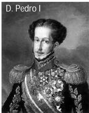
D. Pedro I

Como as cortes não viam com bons olhos o movimento liderado pelo partido brasileiro, que propunha eleições diretas e formação de uma assembleia constituinte, exigiram a ida de D. Pedro para Portugal. Tal exigência foi o estopim da indignação que se formava entre os brasileiros diante da desigualdade de tratamento dado ao Brasil nas decisões sobre os novos rumos do reino. Os objetivos das cortes estavam claros e acabaram por unir ainda mais, as forças do partido brasileiro.