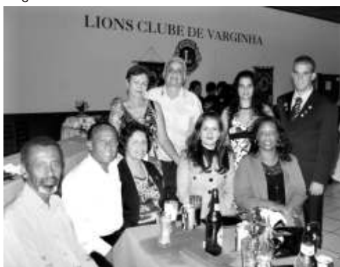
Eis aí o pessoal do Lions Sobral durante a animada noite de companheirismo, realizada na sede do Lions Clube Varginha Centro, na noite do dia 14 de fevereiro.