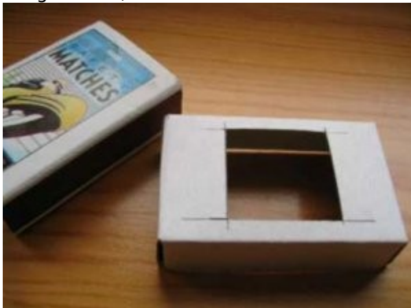
Faça um quadrado de 24x24mm

1º) Primeiro desenhe um quadrado de 24mm exatamente no centro da caixinha de fósforos, como na foto abaixo. Esse quadrado vai dar o formato da imagem, qualquer borda áspera ou rebarba da caixinha aparecerá na imagem final, obviamente.