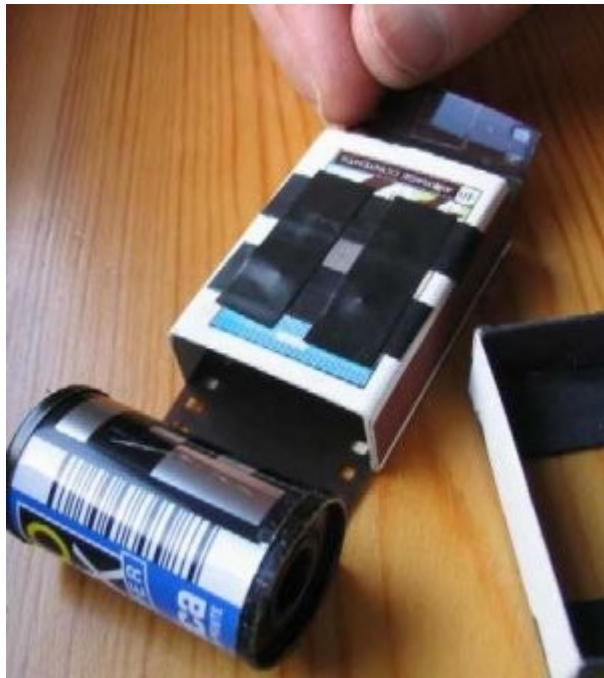
Filme encaixado (literalmente)

7º) Agora coloque o filme novo por entre a caixa. Depois empurre a bandeja interna para dentro da base com o buraco de 24x24 mm contra o filme.