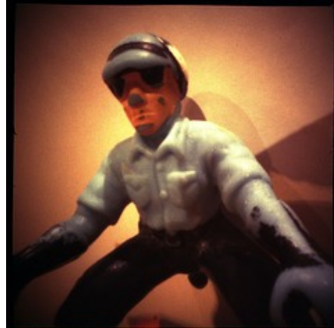
Exemplos de fotos tiradas com uma câmera pinhole .