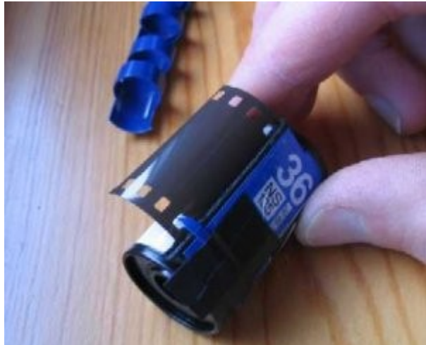
O plástico fará um estalo quando o filme rolar

6º) Agora pegue o rolo de filme novo. Coloque o plástico curvado nas costas do suporte dele de tal maneira que a ponta fique encostada nos orifícios do negativo, assim como se vê na imagem abaixo. À medida que o filme for saindo do carretel, o plástico pulará entre os orifícios e fará um estalo. Para cada pose você conta seis estalos.