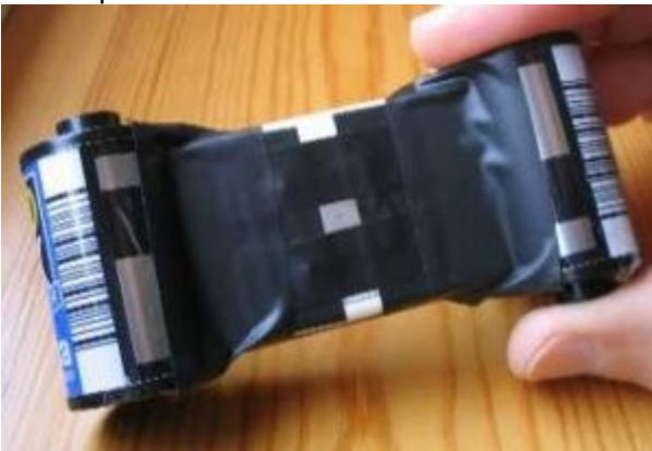
Câmera pinhole protegida

9º) Enrole fita isolante em volta das uniões entre os carretéis e a caixa. Assegure-se que todos os lados estão bem cobertos. A fita adesiva preta é ótima pra isso, mas não deixe que a danada da luz entre.