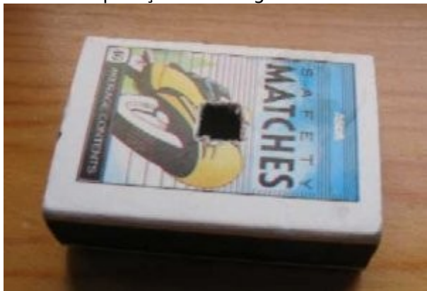
Pequeno buraco no centro da caixinha

3º) Corte um pequeno buraco de aproximadamente 6 mm na parte externa da caixinha, bem no centro dela. Tente fazer isto o mais preciso possível para evitar que as rebarbas apareçam na imagem.