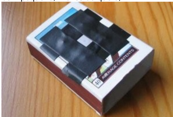
Papel alumínio colado na caixa de fósforos

4º) Faça um furo com agulha em um pedaço da folha de alumínio e coloque-o por cima do buraco, prendendo com fita isolante. Como o comprimento focal é bastante curto, isso significa que o tamanho do furo deve ser bem pequeno, menos do que 0,2 mm.