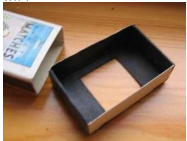
Pinte a parte interna da caixinha de preto

2º) Agora pegue um pincel preto e pinte por dentro da caixa e nos lados também. É importante que a caixinha fique totalmente escura.