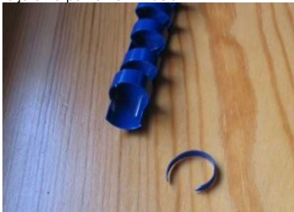
Plástico p/ fazer estalos nos dentes do filme

5º) Para calcular a distância certa para enrolar o filme, faça pequenos "clickers" com pedaços de plástico (como nas embalagens de margarina). Corte uma tira bem fina e faça uma ponta no fim dela.