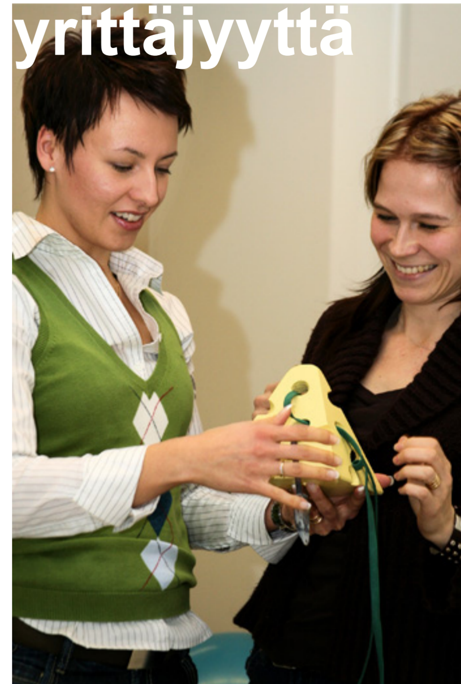
Toimintaterapian kauniit ja rohkeat

”Ehkä on parempia aikoja, mutta tämä aika on meidän.”