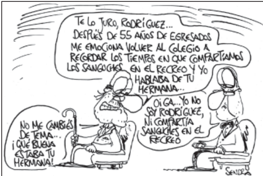
Nuestro agradecimiento al humorista Fernando Sendra por cedernos este dibujo