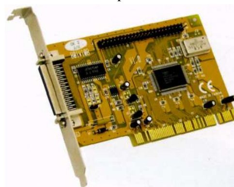
Adaptador host SCSI.

Los dispositivos SCSI se encadenan en margarita para formar una cadena de dispositivos entrelazados denominada cadena SCSI. La cadena SCSI se conecta al PC a través de un dispositivo denominado adaptador host. Algunas placas base avanzadas incluyen un adaptador host SCSI (figura 1.1) integrado, pero la mayoría de los adaptadores host son tarjetas PCI que tienes que encajar en tu placa base. Si quieres usar dispositivos SCSI, tienes que tener un adaptador host.