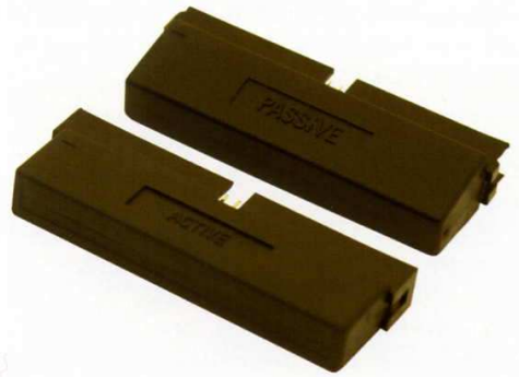
Figura 10.14. Terminales SCSI activo y pasivo.