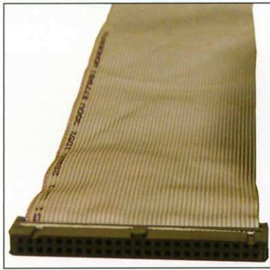
Figura 10.11. Cable SCSI de 50 pines.