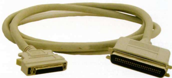
Figura 10.12. Cables SCSI-1 con un conector DB de 25 pines y un conector Centronics de 50 pines.