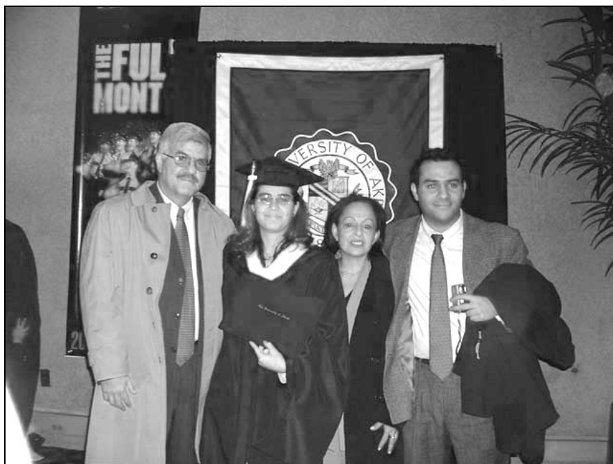
Familia Orozco Varela (Diciembre de 2002)

(UNASMED) desde 1993; miembro del consejo de administración de la Caja Popular Cooperativa entre 1995 y 1998; director médico de la Clínica San Diego de Bogotá en 2001. Como médico y director del Hospital San Rafael de Tocaima conoció de la aguda problemática sanitaria, que con graves repercusiones a nivel genético significaba la utilización de las aguas contaminadas del río Bogotá para los acueductos de las localidades de Apulo y Tocaima. Su denuncia a nivel regional y nacional llevó a la construcción de nuevos acueductos, alimentados estos sí por aguas aptas para el consumo humano extraídas del río Calandaima. En 1984 fue elegido como concejal de Tocaima por el Nuevo Liberalismo, ocupando la presidencia de dicho ente representativo.