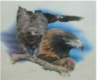
Paintings for sale in our Silent Auction