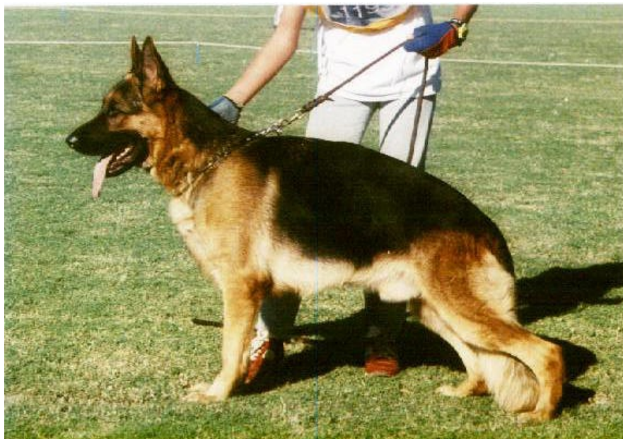
SIUX VOM TENDRESSE

-En Argentina la línea Mutz también fué compatible con la línea Uran ( dando a Bull der Watchhund ), y con la de Visum Arminius dió a Solo von Sprinteen y Viador von Kisman.