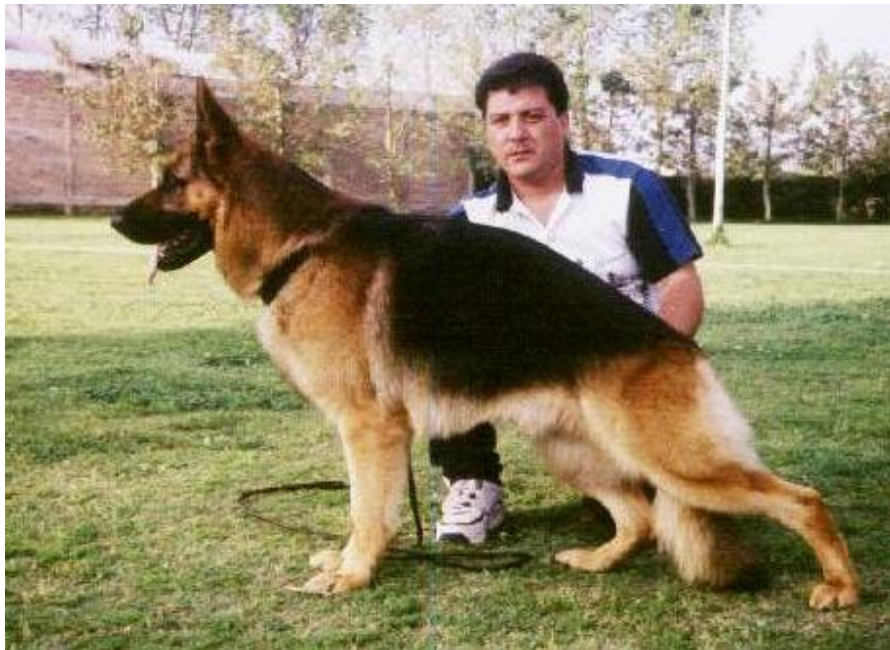
BULL DER WATCHHUND