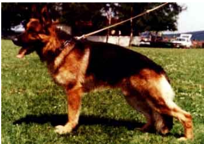
JUPP HALLER FARM

-Analizando la consanguinidad de Jupp, vemos cómo se va fijando el "tipo" determinado. El 4-4 en Gero ( padre de la madre de Mutz ), y el 4-4 en Vello zu den Sieben Faulen - línea directa de Rolf, hace que la línea empuje hacia las generaciones venideras un equilibrio determinado entre las dos líneas principales.