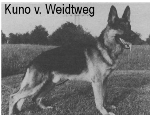
KUNO VON WEIDTWEG

Otro hijo de Jhonny, Kuno Weidweg de tamaño grande dio a Nick Wienerau padre de la mítica Palme y por tanto abuelo de Uran y de Quandt Arminius.