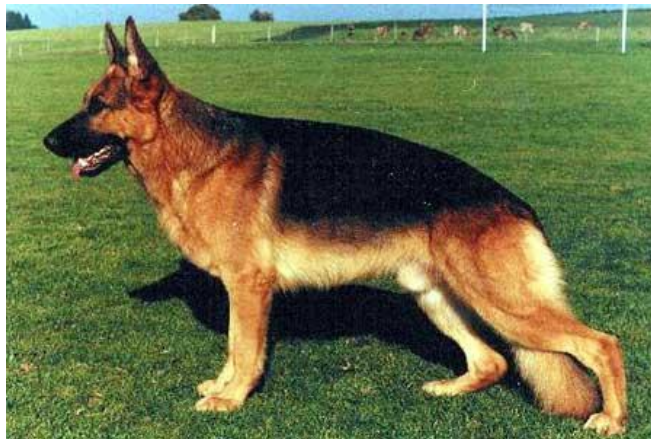
EIKO VOM KIRSCHENTAL

Probablemente su mejor hijo macho fue Eiko Vom Kirschental sieger en el 88. fue el mejor reproductor en calidad y continuidad de hijos de Uran, pero no debemos olvidar que su madre era Xita vom Kirchental hija de Lasso y como también tenía sangre de Canto la grupa de Eiko era superior a la de su padre, y al mismo tiempo gracias a Lasso mejoraba la pigmentación, Eiko en sus grupos de progenie mantuvo la calidad general, homogeneidad de tipo respecto al padre, buena diferenciación de sexos, con muy alto grado de calidad general en todos los años que se presento.