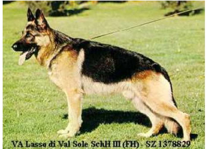
LASSO DI VAL SOLE

Estos dos perros con muchos hijos excelentes van a ser la mejor continuidad de la sangre de Quanto.