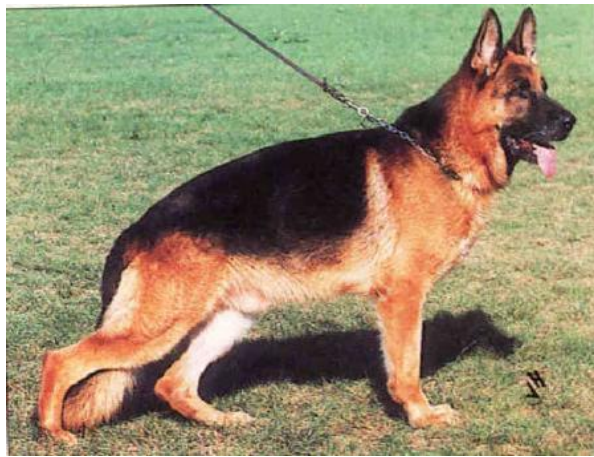
ODIN VON TANNENMEISE