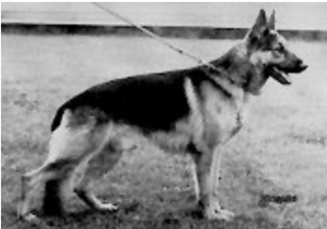
ARGUS VOM KLAMMLE