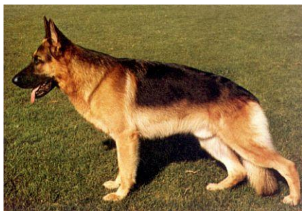
URAN VOM WILDSTEIGER LAND