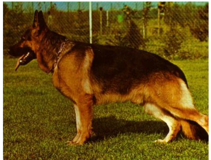
QUANTO V.D. WIENERAU