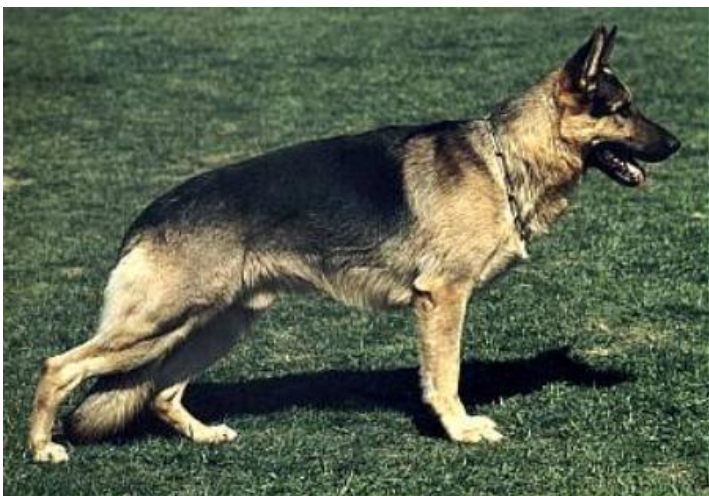
GAUNER VON GRÜNDEL