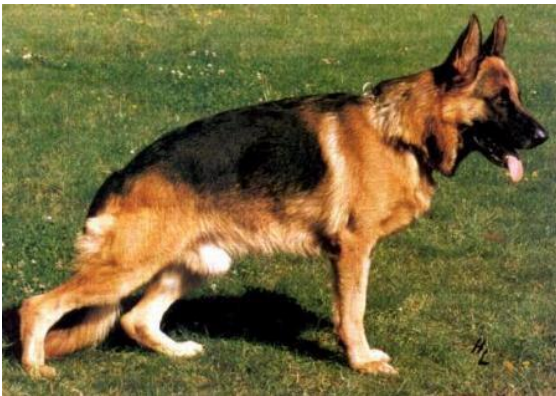
VISUM VOM ARMINIUS

Jeck como Zamb también recibía sangre Mutz a través de Dax Wienerau hijo de Jupp. Tuvo muy buenos descendientes como Visum vom Arminius varias veces aulese y sieger en 1996, pero quizás la mejor continuación de Jeck fue a través de Hobby vom Gletschertopf. padre de Ursus.