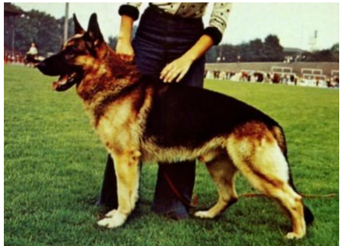
JALK VON DER RHEINHALLE