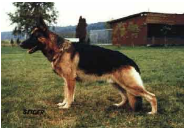
IRK VON ARMINIUS