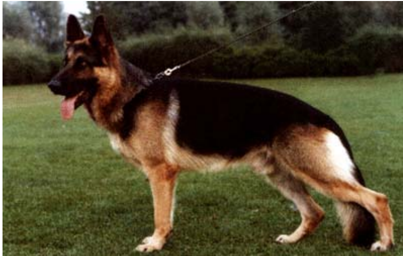
ZORRO VON DER MOLANAKKER

V Jacco von der Molenakker - Da a VA9 en el 77 Zorro von der Molenakker que no deja descendencia importante.