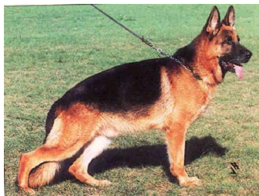
ODIN VON TANNENMEISE