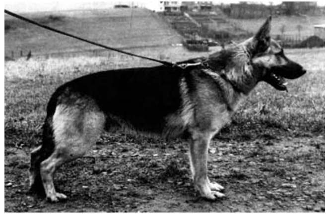
JALK VON FOHLENBRUNNER

Jupp era un ejemplar de tamaño medio excelentes angulaciones traseras y fiel transmisor de la esencia Mutz, presentó cuatro años seguidos grupo de cría, dos hijos destacaron y representaron dos sublíneas Dax Wienerau y Putz von Arjakjo. A Dax lo dejamos para después pues de ahí descende Cello von Romerau, atípico en Mutz y que recibió más influencia de su madre Quana Von Arminius hermana del doble sieger Quando Arminius.