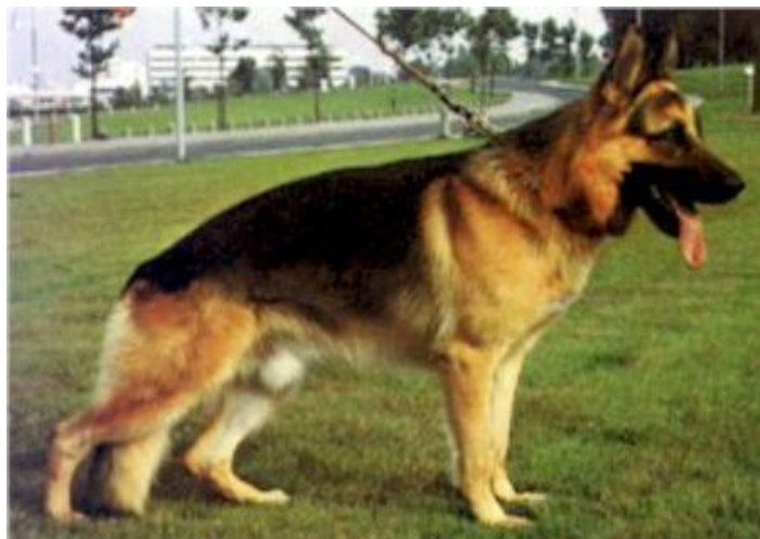
DAX VOM KOPERKAMP

Antes de seguir con Jupp, decir que Gauner con sus hijos Dax Koperkamp, Bar von Klostemborgen y Watz Koperkamp fue lo más destacado pero no cuajo.