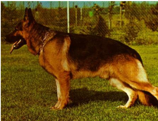
QUANTO VON DER WIENERAU

Si bien lógicamente hay muchos mas hijos, estas dos sublíneas serían las más representativas que posteriormente entroncaron con la línea Quanto Von Der Wienerau. Se dio una sublínea interesante a través de Fedor von Arminius, descendiente ya lejano de Canto Wienerau pero también con consaguinidad en Quanto, apareciendo por ejemplo el hijo de Fedor, Jello Wienerau y su hijo Hanno, que llegaron a presentar buenos grupos en la Sieger.