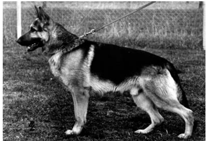
PIROL VON ARMINIUS