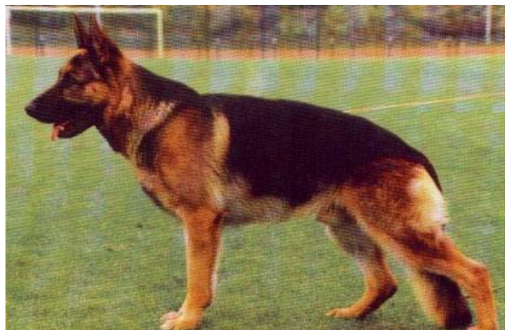
QUANDO VON ARMINIUS