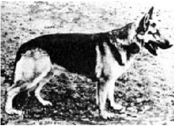
VELLO ZU DEN SIEBEN FAULEN