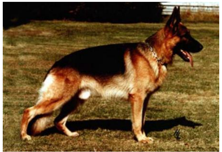
PUTZ VON ARJAKJO

Putz fue criado en Holanda, fue adquirido por Sttenner a la edad de dos años, lo presenta en la sieger y después de marchar todo el tiempo detrás de Dingo, es vencido por el papeleo, ya que su abuela materna no había ido a la escuela, se localizó a la abuela y se le hizo la escuela grabándola para que no hubiese suspicacias, con lo cual Putz pasó al cuadro de los Auleses, era de tamaño medio, ligeramente alargado, muy típico y expresivo, la grupa podría ser más larga, escasa longitud de húmero y angulaciones buenas, siendo injustamente criticado si se tiene en cuenta los Auleses con los que compitió, con un temperamento propio de los mejores perros de trabajo, majestuoso en el ring UN TODO PASTOR ALEMAN, recibía también sangre de Quanto y Canto.