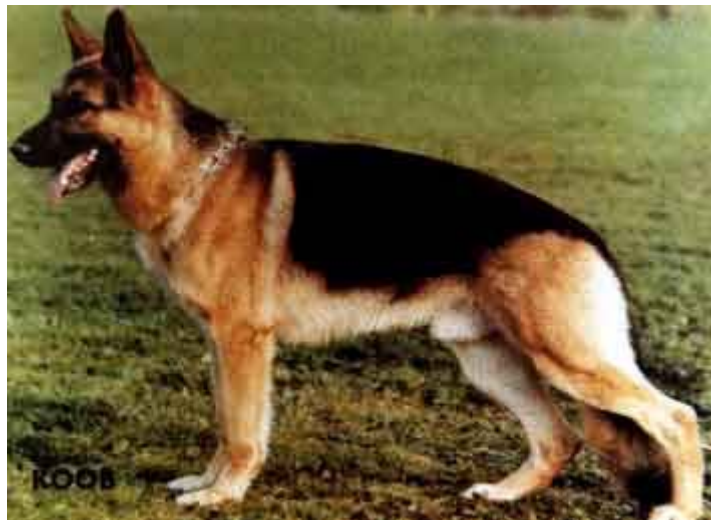
GRANDO VOM PATERSWEG

Dick produjo a Grando, otro auslese magnifico, Por esta línea viene Elch Gundo , Jack,Casht.