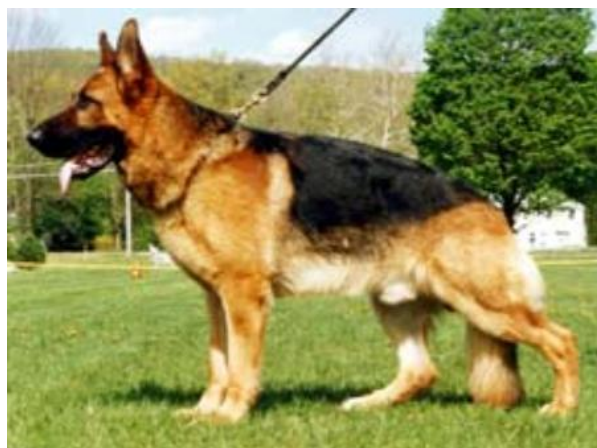
JELLO VON DER WIENERAU