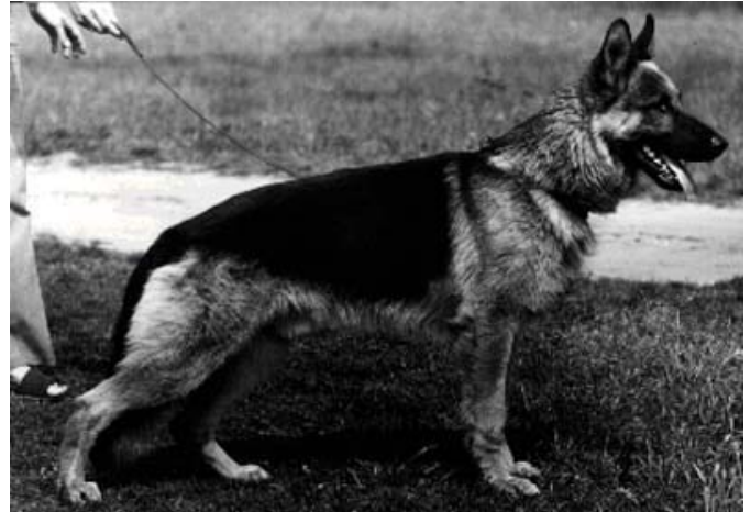
CASAR VON ARMINIUS