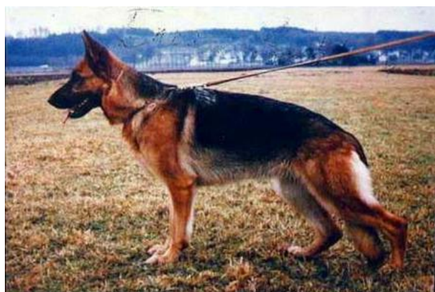
PALME VOM WILDSTEIGER LAND