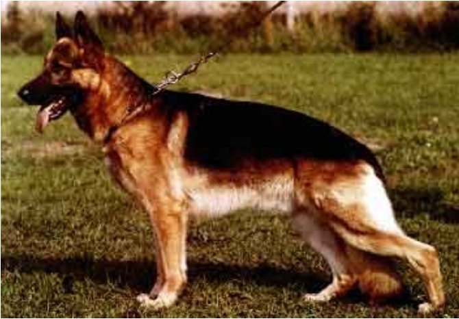
CANTO VON ARMINIUS

Canto murió joven y aun así su descendencia es muy numerosa en Alemania Francia e Italia así como en España. Entre los que más han influenciado en la raza son Canto Von Arminius, Aulese del 74 al 76 y Sieguer en el 78 así como su hermano Casar Von Arminius, sin olvidar a Argus vom Klammle y su hermano Aslam. Canto Von House Niermann así como el Aulese del 74 y 75 Datscha Von Patersweg.