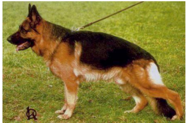
HOBBY VOM GLETSCHERTOPEF

Ursus von Batu el sieger 2000 y varias veces aulese, hijo de Hobby vom Gletschertopf tenía como abuelo paterno a Jeck y como abuelo materno a.... Zamb, es decir Quanto- Cuando al cuadrado para bien y para mal.