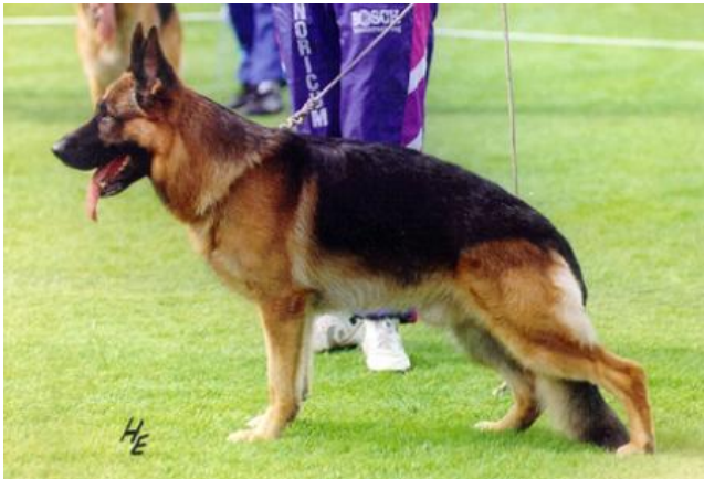
JECK VON NORICUM