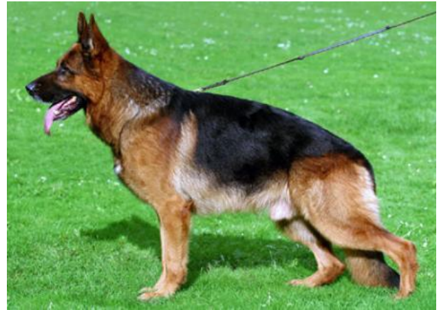
LARUS VON BATU