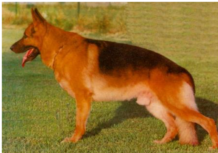
WATZ VOM KOPERKAMP

Otro hijo de Jhonny, Kuno Weidweg de tamaño grande dio a Nick Wienerau padre de la mítica Palme y por tanto abuelo de Uran y de Quandt Arminius.