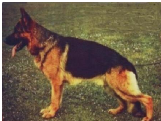
ENZO VON DER BURG ALISO

Odin, hijo de Quando era un perro de estructura excelente que se aproximaba mucho al ideal en posición de parado, sin embargo no le gustaba caminar, era un macho grande muy típico y sustancioso, muy buena línea superior y muy buena situación y dimensión de la grupa con pigmentación excelente