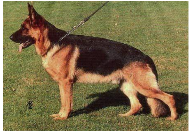
ZAMB VON DER WIENERAU

Por otro lado otro hijo de Quanto, Clif von haus Beck nos llevara a traves de Pirol –Irk Arminius a Uran con madre Palme.