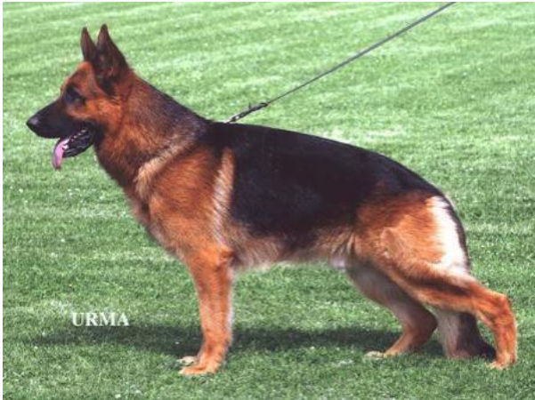
YASKO VOM FARBENSPIEL

Ursus perro con una gran pigmentación es el padre de Yasko doble sieger 2001-2002 que su vez es el padre del doble sieger actual Larus von Batu 2004-2005 y del varias veces aulse Erasmus van Noort y de otros muchos excelentes perros.