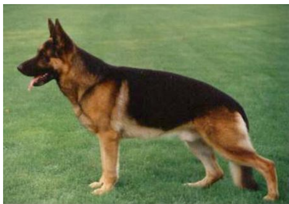
ISO VOM BERGMMANSHOF