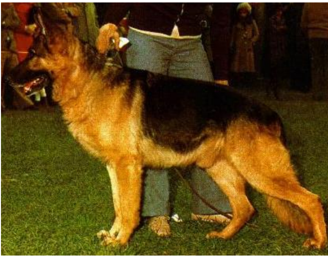
MUTZ V.D. PELZTIERFARM