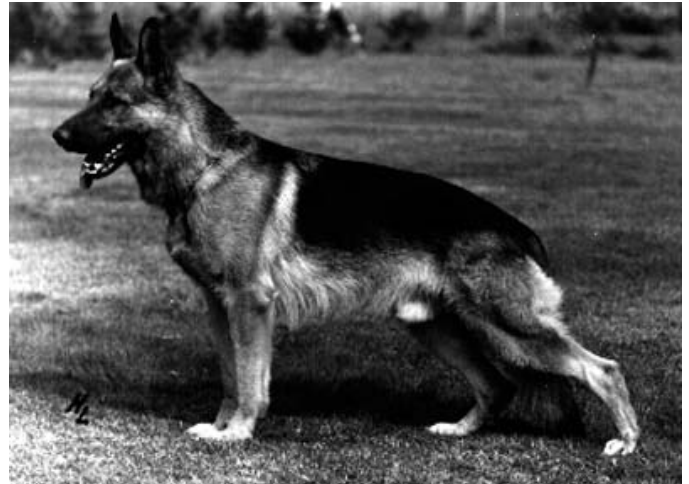
CANTO V.D. WIENERAU