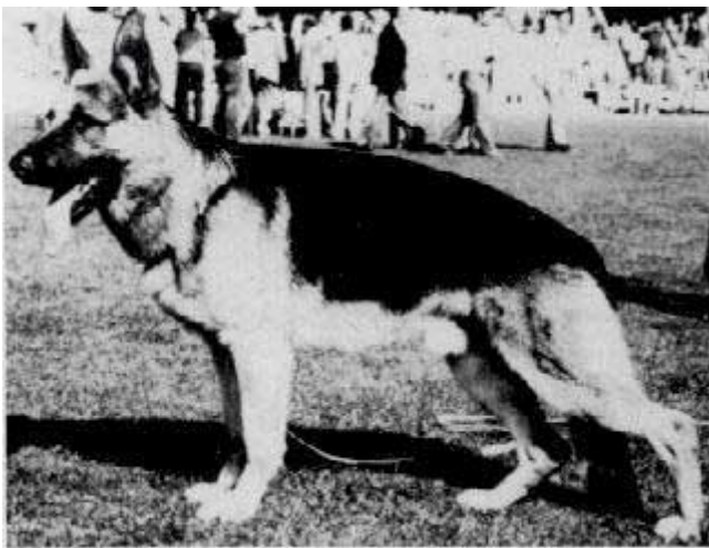
DAX VON DER WIENERAU

Jupp era un ejemplar de tamaño medio excelentes angulaciones traseras y fiel transmisor de la esencia Mutz, presentó cuatro años seguidos grupo de cría, dos hijos destacaron y representaron dos sublíneas Dax Wienerau y Putz von Arjakjo. A Dax lo dejamos para después pues de ahí descende Cello von Romerau, atípico en Mutz y que recibió más influencia de su madre Quana Von Arminius hermana del doble sieger Quando Arminius.