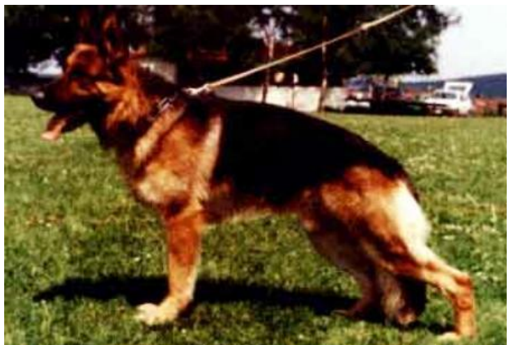
JUPP VON DER HALLER FARM