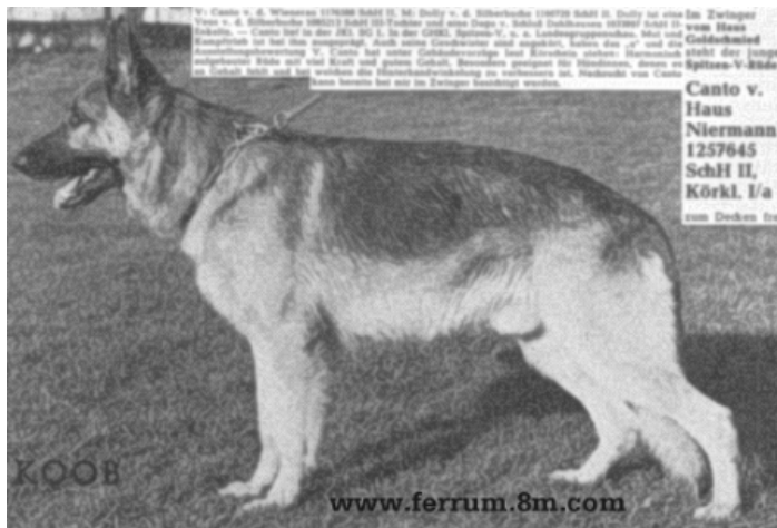
CANTO VON HOUSE NERMANN