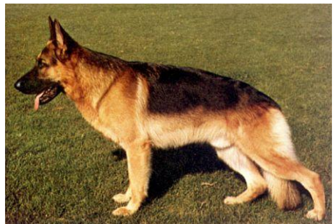
URAN VON WILDSTEIGER LAND