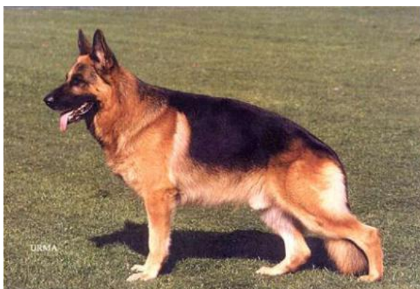
ULK VOM ARLETT

Ulk tenía un excelente movimiento, se le podía pedir mayor longitud de grupa pero sobre todo presento muy buenos grupos de progenie.