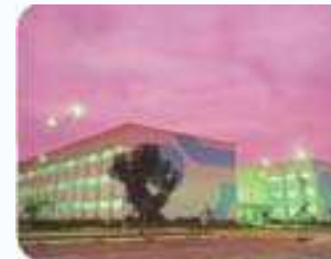
Campus Araranguá Araranguá Criciúma Içara