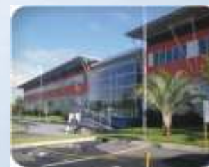
Campus Norte da Ilha Florianópolis