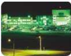
Campus Grande Florianópolis Palhoça Florianópolis