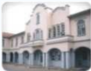
Campus Tubarão Tubarão Braço do Norte Imbituba