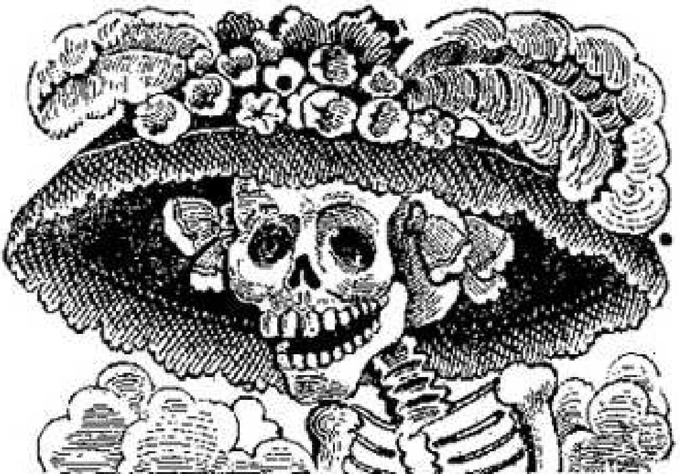
La Catrina, José Guadalupe Posada

Ofrenda, Misticismo y Tradición mexicana.