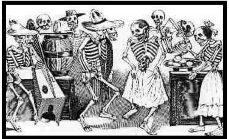
Jarabe, dibujo de José Guadalupe Posada

Sobre sus altares encienden velas de cera, queman incienso en bracerillos de barro cocido, colocan imágenes cristianas: un crucifijo y la virgen de Guadalupe. Ponen retratos de sus seres fallecidos. En platos de barro cocido se colocan los alimentos, estos son productos que generalmente ahí se consumen, platillos propios de la región. Bebidas embriagantes o vasos con agua, jugos de frutas, panes de muerto, adornados con azúcar roja que simula la sangre. Galletas, frutas de horno y dulces hechos con calabaza.