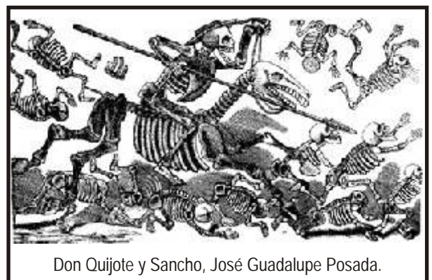
Don Quijote y Sancho, José Guadalupe Posada.