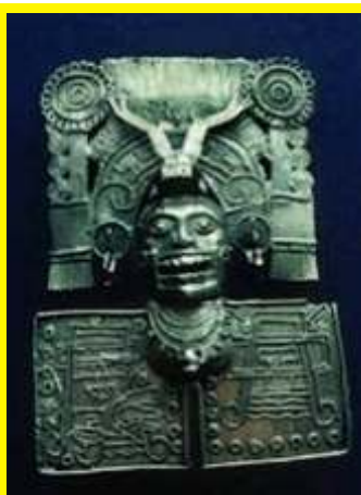
Mictlantecuhtli Pectoral de oro mixteca que se conserva en el Museo Nacional de Antropología de México y que representa al dios de la muerte Mictlantecuhtli.

Las zonas privilegiadas del Mictlán donde llegaban directamente los militares muertos en combate o en la piedra de los sacrificios (techcal), era el Tonatiuhuichan (casa del sol). El Cincalco (casa del maíz) destinado a las mujeres que murieron en el parto, y el Tlalocan (aposento de Tlaloc) morada para los ahogados o muertos por el rayo.