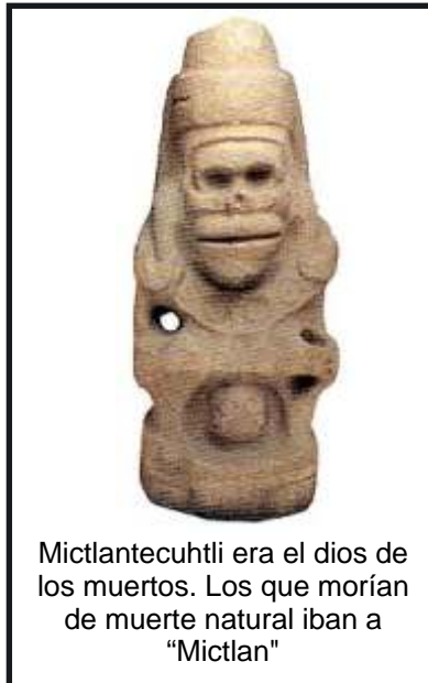
Mictlantecuhtli era el dios de los muertos. Los que morían de muerte natural iban a "Mictlan"