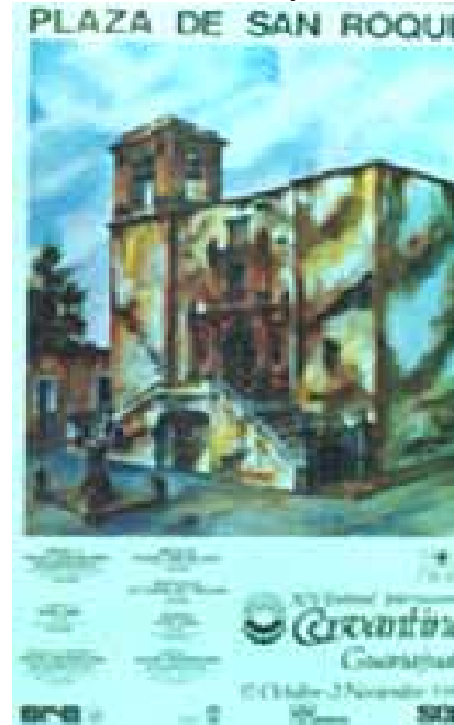
Imagen Institucional, Carteles y Acuarelas, para el XV y XVI Festival Internacional Cervantino (1986-88)