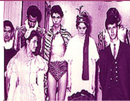
Actor de Teatro, del INJUVE y la UNAM (1960-63)

Para mayor información, al respecto y conocer sus Productos Editoriales-Virtuales, es posible " visitar " su SITIO de INTERNET, PROFESIONAL > www.geocities.com/encael .