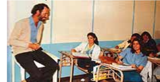
Profesor Universitario (1962-2006)