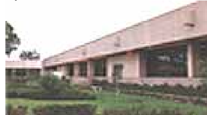
Proyecto Arquitectónico, de la Nueva Sede de la Delegación Política de Iztacalco, C. de México-1990