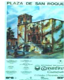
Imagen Institucional, para el XV y XV I FIC (1986-88)