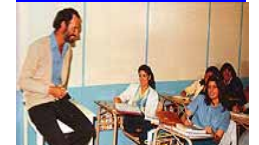
Profesor Universitario (1962-2008)