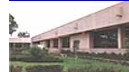
Proyecto del Edificio de la Delegación Política de Iztacalco, D.F. (1990)