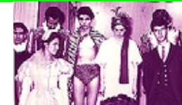
Actor de Teatro, del INJUVE y UNAM (1960-63)

Para mayor información, al respecto y conocer sus demás Productos Editoriales-Virtuales, " visite " su SITIO de INTERNET, PROFESIONAL > www.geocities.com/encael .