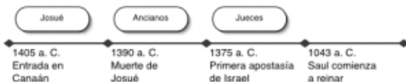
Figura 2. El pueblo de Israel hasta Saul

El segundo esquema abarca el tiempo que va desde la entrada del pueblo de Israel en la tierra de Canaán para poseerla, con Josué como caudillo, hasta que se estableció la monarquía en Israel, con Saul. El registro de este período lo encontramos en los libros de Josué y Jueces; y el pueblo estuvo dirigido por Josué, desde 1405 a 1390 a. C.; por los ancianos, desde 1390 a 1375 a. C.; y por los jueces, desde 1375 a 1043 a. C., o sea por unos 332 años.