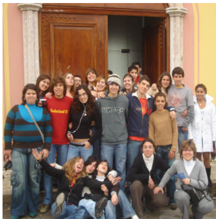
Centro Comercial Colombo, onde os alunos e as professoras tiveram

um pouco de “liberdade”. Mais tarde, por volta das 16 horas, foram todos ao teatro, para ver a peça “A Lua de Joana”, uma história que alerta, sobretudo os adolescentes, para o perigo das drogas e das suas consequências.