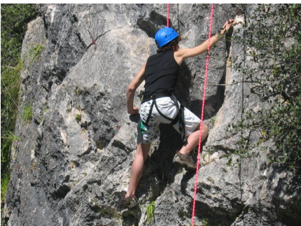
Saída a Olhos de Água

Uma comitiva de 3 professores de Educação Física e 50 alunos do ensino secundário participaram em actividades físicas e desportivas realizadas em Olhos de Água, nos passados dias 21 e 22 de Março. Os alunos tiveram oportunidade de praticar actividades tão variadas como orientação, seringaboll, BTT, entre muitas outras. O grupo divertiu-se bastante, ficando no ar a ideia que os dois dias souberam a pouco e a promessa de que para o ano haverá mais.