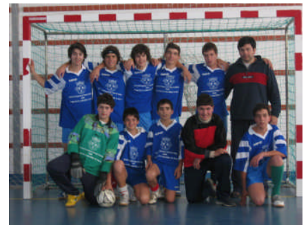
Equipa de iniciados