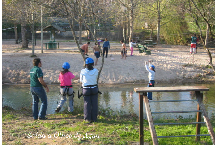
Saída a Olhos de Água

No passado dia 23 de Março, uma equipa de futsal de professores da nossa escola enfrentou e perdeu frente aos alunos em mais um convívio de final de período. O torneio quadrangular contou ainda com a presença de uma equipa de antigos alunos, que aproveitaram a oportunidade para recordar velhos tempos.