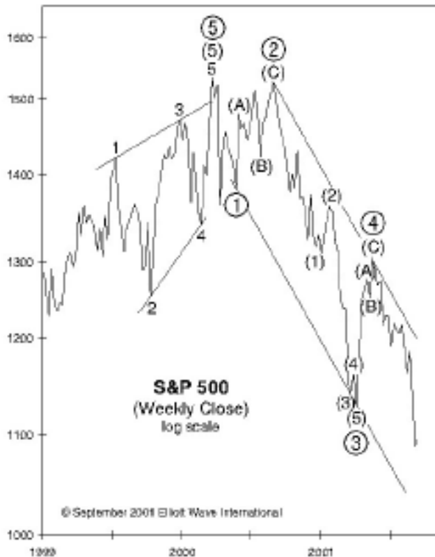
Figure complete in 5 Onde di grado Primario dal 1° quarto 2000: