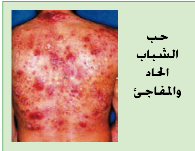
حب الشباب الحاد والمفاجئ

حب الشباب الحاد والمفاجئ: نوع نادر وشديد من أنواع حب الشباب الكيسي ويحدث بشكل مفاجئ وسريع بظهور حبوب ودمامل وأكياس ملتهبة خصوصا في منطقة الظهر والصدر. يصاحب هذه الحبوب ارتفاع في درجة الحرارة وألم في المفاصل وارتفاع في مستوى كريات الدم البيضاء في الدم. وهذا النوع يحدث غالبا عند الذكور.