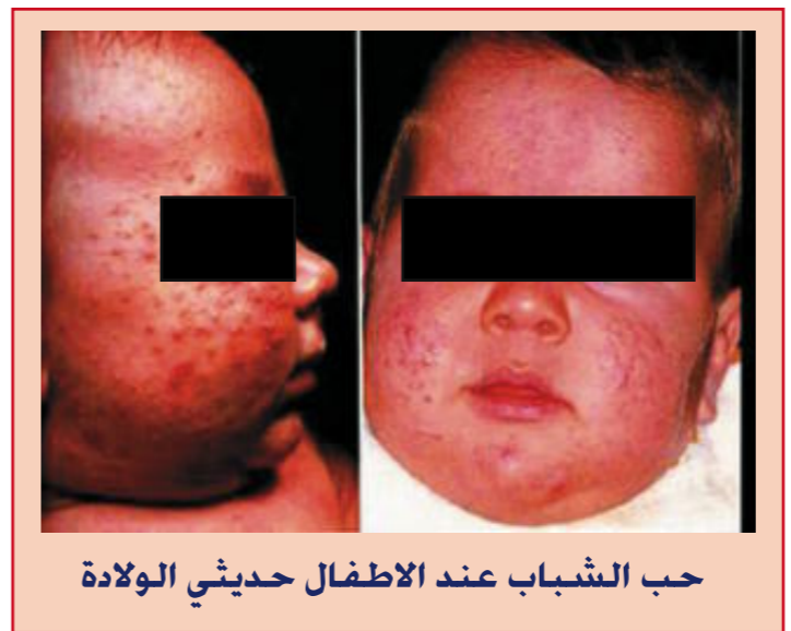
حب الشباب عند الاطفال حديثي الولادة

من الممكن أيضا أن يصيب مرض حب الشباب الأطفال الصغار خاصة في عمر ما قبل السننتين لا سيما في أول ثلاثة شهور. وتكون منطقة الإصابة فقط في الوجه إلا أن الصدر والظهر غير معرضين للإصابة بهذا النوع من حب الشباب. وعادة يختفي حتى من غير علاج خلال سنة تقريبا. والسبب في إصابة الأطفال بهذا النوع من حب الشباب مجهول حتى الآن. لكن أقرب النظريات إلى الواقع هي وصول هرمون الأندروجين من الأم إلى الطفل. ومعروف علميا أن هذا الهرمون له دور في ظهور حب الشباب.