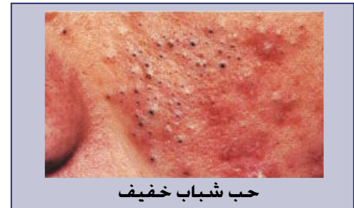
حب شباب خفيف

ويفضل استخدامه مع المراهم التي تحتوي على مستخلصات فيتامين (أ) Retinoids والتي تزيل الطبقة القرنية Keratolytic على البثور لتسهيل عملها. هذه المادة يمكن أن تسبب تهيج الجلد فالأفضل اختبارها على الجلد قبل وضعها على الوجه أو توضع لفترة قصيرة يومياً بحيث لا تزيد عن ٣٠ دقيقة.