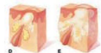
مرحلة التكتيس البثور المتقيحة

٣ - تكاثر ونمو البكتيريا (بروبيوني بكتيريوم أكنيس) (Propionibacterium Acnes) التي توجد بشكل طبيعي على الجلد، حيث أن البيئة الغنية بالإفرازات الدهنية وقلة الهواء في المسامات نتيجة الانسداد، مناسبة جدا لتكاثرها.