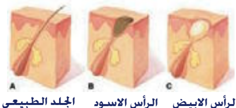
الجلد الطبيعي الرأس الابيض الرأس الاسود

١ - زيادة حجم الغدد الدهنية وإنتاجها وإفرازها للزهم Sebum (أي المادة الدهنية) في الجلد. تحت تأثير الهرمونات الذكرية Androgens في مراحل البلوغ، التي تفرزها الغدة Adrenal Gland الذكرية. وهذه الزيادة في حجم وإفراز الغدد الدهنية تؤدي إلى ضيق في القنوات الدهنية، التي تمر من خلالها الإفرازات الدهنية للجلد. أما في الأحوال الطبيعية، تسير هذه الدهون من الغدة الدهنية عبر هذه القنوات القصيرة إلى سطح الجلد بتدرج وسهولة ثم تزال عند مسح أو غسل الجلد. ٢ - زيادة التقمر Keratinization في جريب الشعر (الكيس الذي تخرج منه الشعرة) ومن ثم انسداده وجمع الدهون فيه.