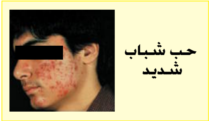
حب شباب شديد

١ - المضادات الحيوية عن طريق الفم Oral Antibiotics , وأكثرها استخداماً التتراسايكلين Tetracycline وهي مستخدمة منذ سنوات , وهي لا تستخدم أثناء الحمل. لأنها تسبب تلون الأسنان. وكذلك ماینوسايكلين Minocycline و دوكسي سايكلين Doxycycline.