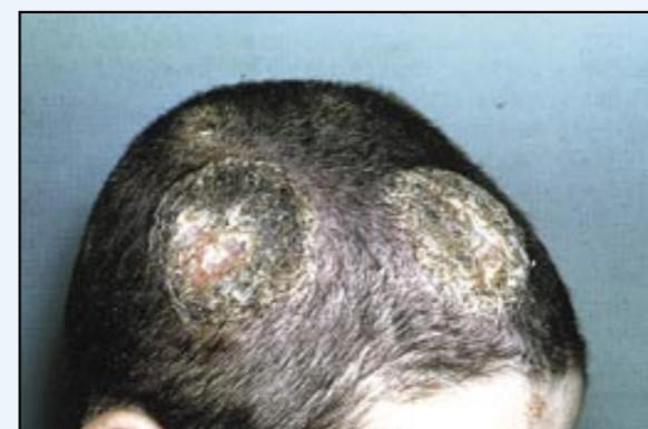
صورة 8 : لطفل يعاني من صلع الالتهاب الفطري في الرأس

إذن تساقط الشعر والصلع من الحالات الشائعة التي يجب علينا معالجتها و تجنبها في مجتمعنا و بما أن الشعر يعكس هيئة أو شكل كل شخص فالاهتمام به والحفاظة عليه امر مهم في حياتنا .