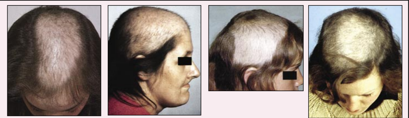
صور ٧ : لمرضى يعانون من عادة شد الشعر التلقائية

و غالبا ما ينكر الوالدين هذه العادة . والعلاج يكمن في توضيح المشكلة للوالدين و الطفل وفي بعض الحالات نلجأ الى إستشارة الطبيب النفسي لحل هذه المشكلة .